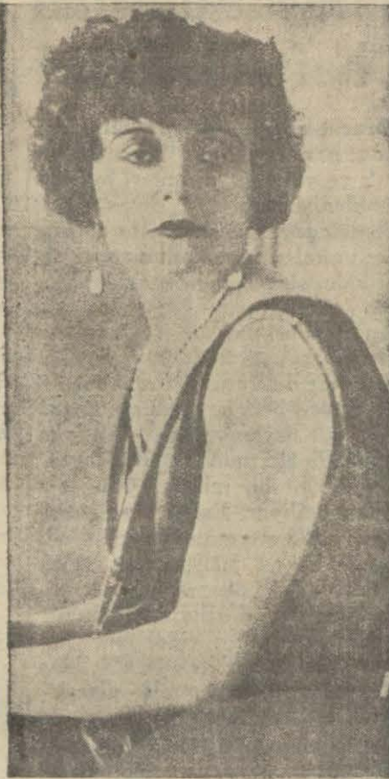
Pola Negri artık eskisi kadar muazzam yekûnlara varan haftalıklar alamaz

Şimdiye kadar büyük bir erkânı harbiyesi olan sahne vazılarının, şimdi birkaç muavinden başka kimse yoktur. Amerikan stüdyoları