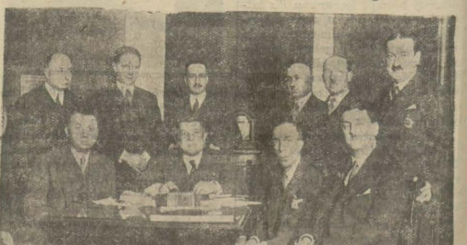
Sivil tayyare kulübü heyeti idaresi dün içtima etmiştir. Çok yakında faaliyete geçecek olan kulüp için Beyoğlundaki merkezde bir bina bulunmuştur.