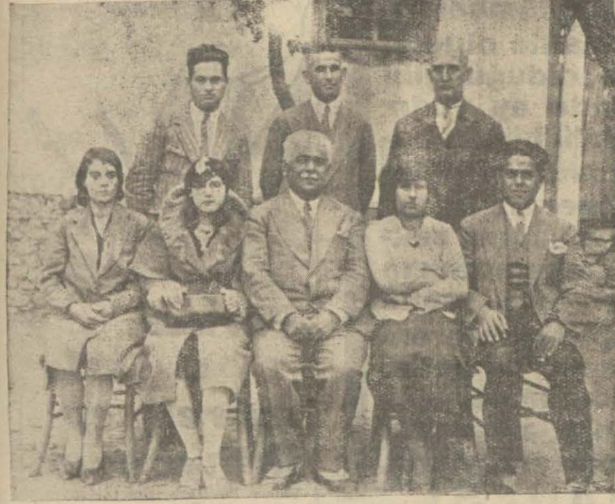
Gerzede Köşk Mektebi muallimleri

Gerze; mukavves bir limanda dağ eteklerinde mine gibi işlenmiş bir şehir..