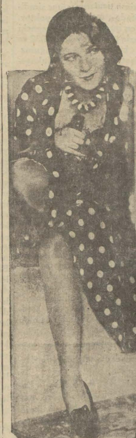
"Mareşal Hazretleri" filminde dith Mera