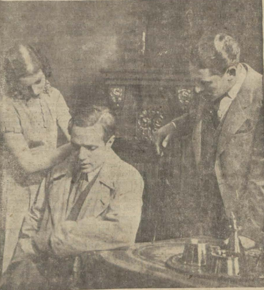
«Müşkül İtiraf» filminden bir sahne