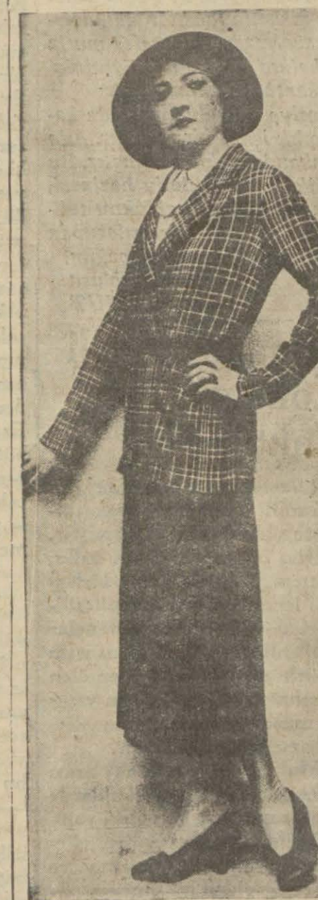
Bu kış kadife siyah jüpü üzerine keskin renkli kazaklar göreceğiz.

Eğer burun kanaması bir hastalıktan ileri geliyorsa, baş öne doğru eğilerek, baş ve enseye soğuk su