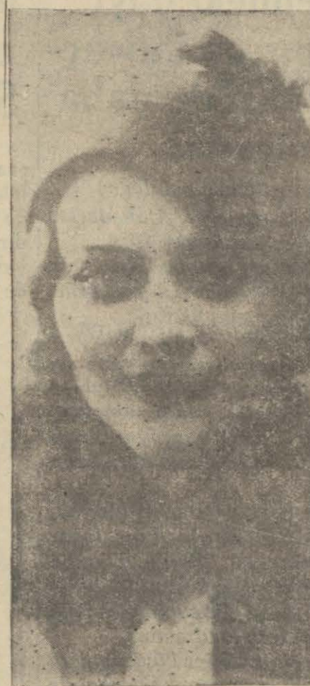
Kış geldi. Tayyör roplarda küçük şapkaların da başka bir zarafeti var. İşte nümunesi.