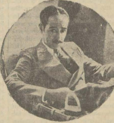
Sinemada artık kimse meselâ Adolphe Menjou payesine kadar çıksa bile, onun aldığı haftalıkları alamaz

bu sayede birkaç ay içinde üç, dört milyon dolar tasarruf etmiş bulunmaktadırlar.