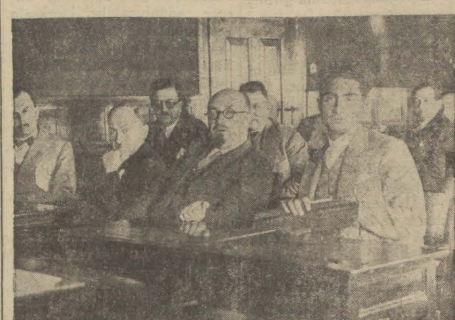
Dün ticaret odasında Türkiye İktisatçıları cemiyeti toplandı ve üç konferans verildi (Yazısı iç sahifelerimizdedir)