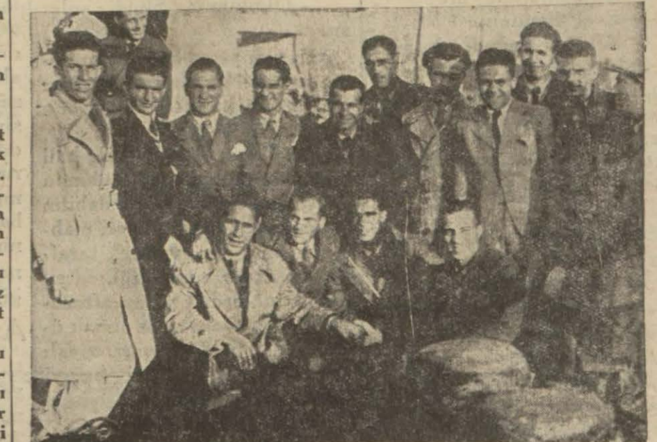
Dün Daçya vapuru ile cuma günü ilk maçını yapacak olan Yunan takımının ikinci kafilesi geldi. Resmimiz onları göstermektedir. Yazısı ve heyet reisinin beyanatı iç sahifelerimizdedir.