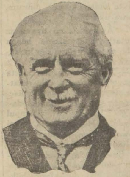
M. Lloyd George