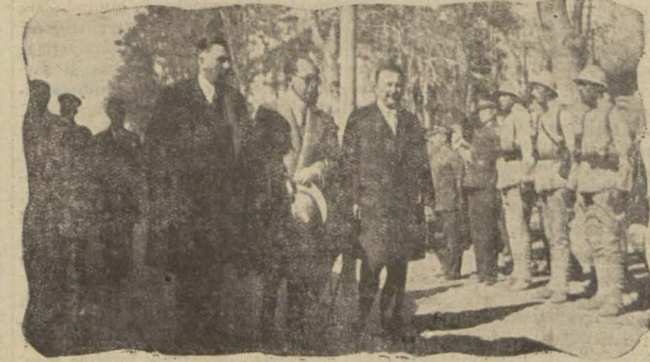
Hariciye Vekili Tevfik Rüşü Bin Ankaraya muvasalatı

Bu takdim merasimini müteakip murahhaslar kendilerine ayrılan sıralarda yer aldılar. Reisiçümhur Hz. kürsüye geldi ve nutkunu Fransızca olarak irat etti. Salonda yükselen alkışlar arasında yer yer kesilen bu nutuk müdafaa edilen büyük davanın kudretli bir tahli ve yepyeni bir vatan kurup Gazi Mustafa Kemal'in bu dava etrafından cihana hitap eden bir beyanamesi idi.