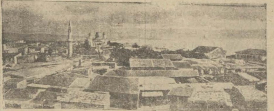
Kıbrısın büyük limanlarından Limassol

Her sene Veremden binlerce vatandaş ölüyor. Cümhuriyet bayramı olan 29 Teşrinievvel perşembe, Verem mücadele günüdür. Ken dinizi, çocuklarınızı, muhiti nizi tehdit eden tehlikeyi tahdit için senede bir lira vererek aza yazınız. Sene de bir lira ayda 9 kuruş bile etmez.