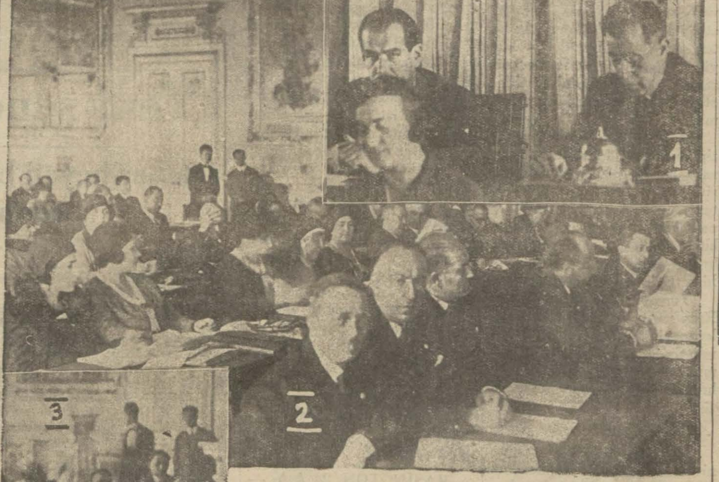
1 — Reis Hasan B. kürsüde. 2 — Türk murahhasları müzakereyi dinliyorlar. 3 — Yunan murahhasları cevap hazırlıyorlar..

Konferans azası bugün Reiscümhur Hz. tarafından kabul edilecekler ve Millet Meclisi salonunda son bir içtima yapacaklardır