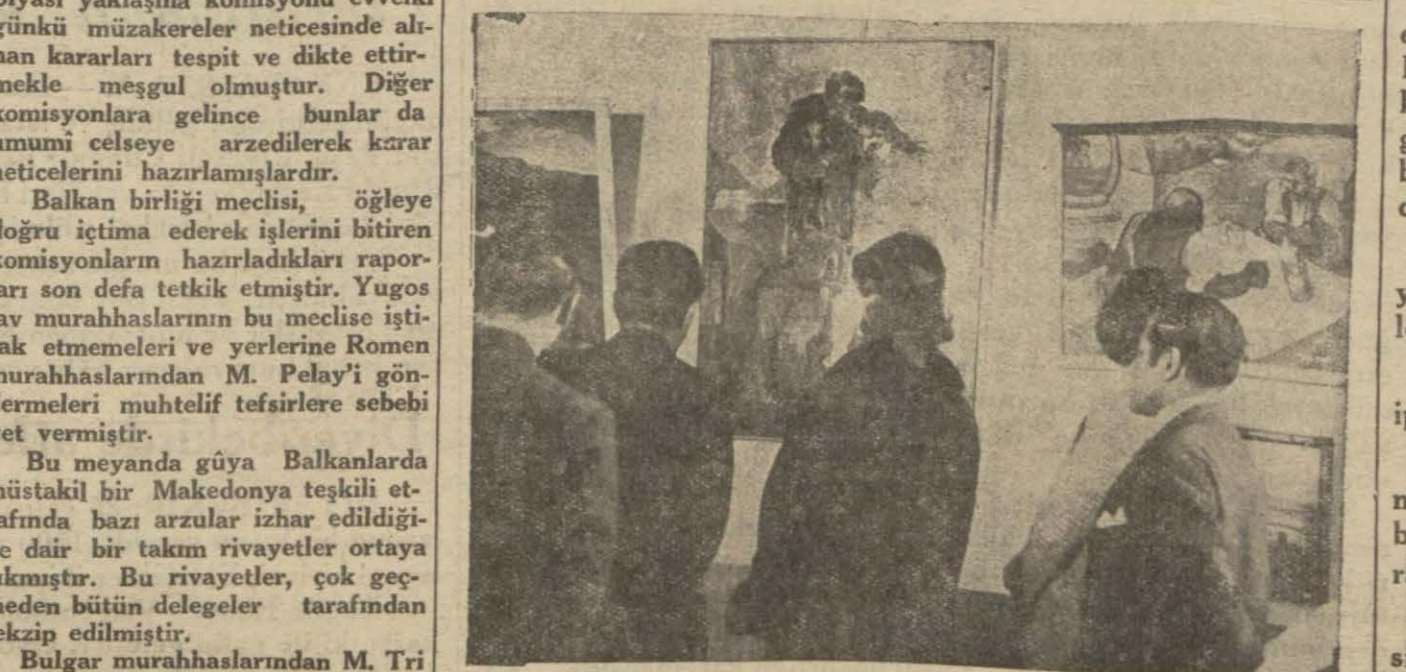
Resim sergisinde ziyaretçilerin tetkiklerinden bir intiba