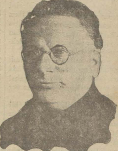
M. Litvinofun en yeni bir resmi

Siviyet Hariciye komiseri M. Litvinof zevcesi ve maiyeti erkânı ile 26 teşrinievvel müsadif pazartesi günü (bugün) sabahleyin hükümet-