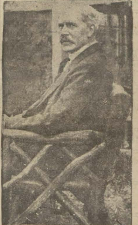
İngiliz Başvekili M. Mac Donald

Ancak kıyamın sebep ve âmilleri eskidir, İngiltere Kıbrıs