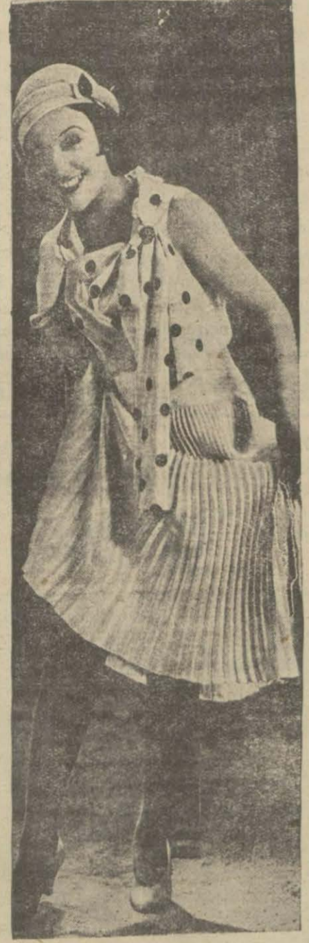
Objektifin karşısında bir jön premiyer

taarruza geçen bu insanlar, şimdi sadece tedafii vaziyettedirler. Onun içindir ki stüdyoda