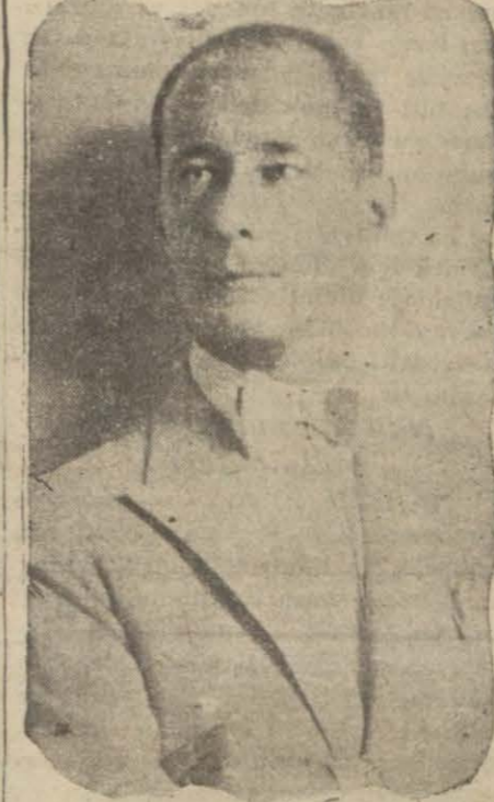
Tahran büyü elçimiz Hüsrev Bey

Tahran sefirimiz bir iki gündüberi şehrimizde bulunmaktadır. Hükümetle temas etmek izahat vermek ve talimat almak üzere bugünlerde Ankara'ya gidecektir. Hüsrev Beyin Tahran'a avdetini mü-