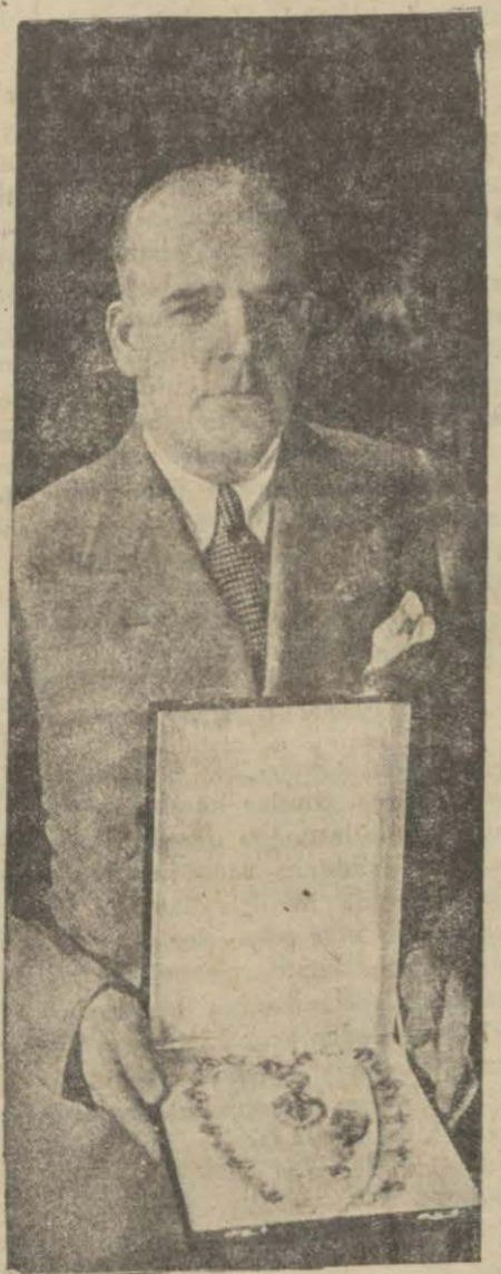
Aldıkları nişanları her gelene gösterirler

Bu kale kumandanının yalnız kendi memleketinden değil