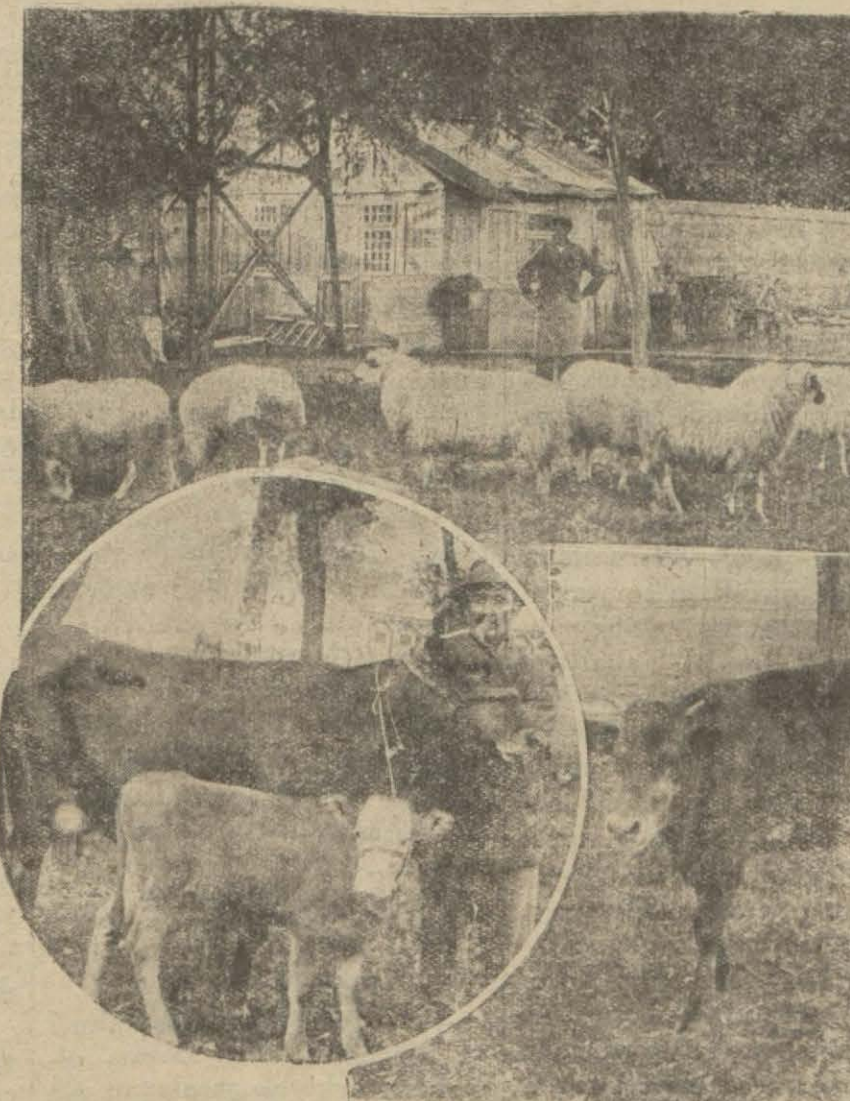
Dolmabahçede eski has ahırlarda yarın açılacak olan hayvan sergisine mükayyet hayvanlar, dün de on kişilik, bir heyet tarafından gözden geçirilmiş ve teşhir edilecek hayvanlar için not verilmiştir. Not muamelesi bu akşam bitirilecek ve sergi yarın açılacaktır.