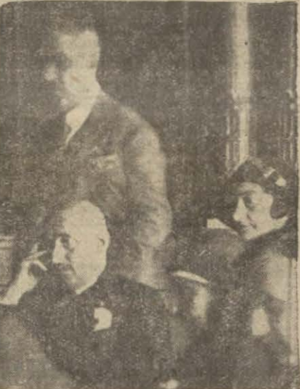
Yunan heyeti reisi M. Papa Anastasjo müzakerenin hararetili bir anında düşünüyor

Balkan konferansı murahhasaları dün sabah Yıldız sarayının merasim köşkünde toplanan komisyonlar da çalışmışlardır. Konferans muhitinden geçen havadan dün pek az eser kalmıştı. Uyuşma temayülle-