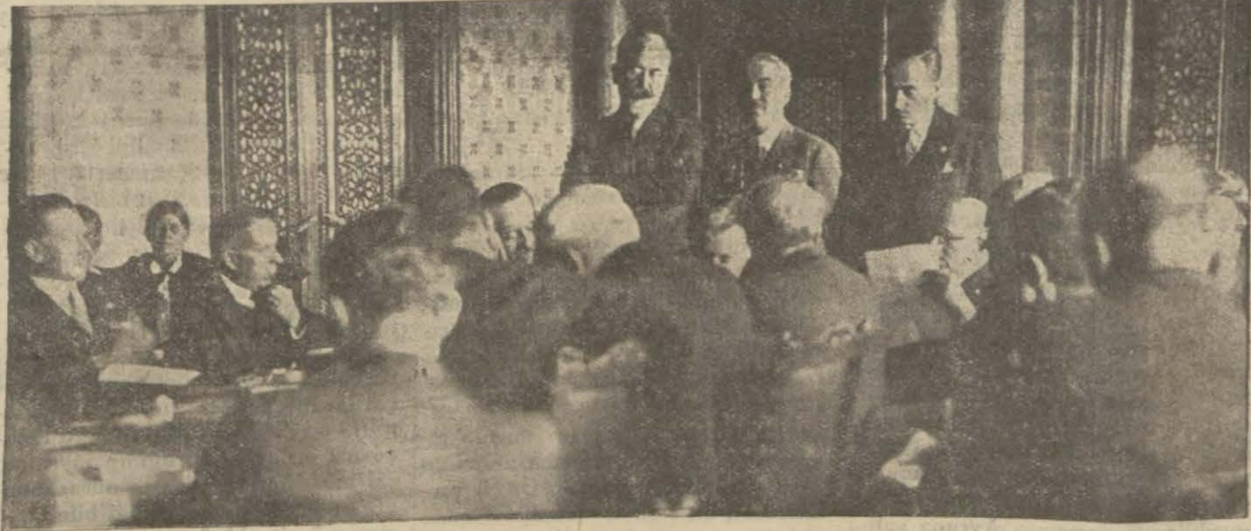
Siyasî komisyon hararetili bir münakaşanın vuku bulduğu bir sırada

Heyeti murahhasamız reisinin Yugoslav ve Arnavut murahhasaları nezdindeki uzlaştırma teşebbüsü muvaffakiyetle neticelendi