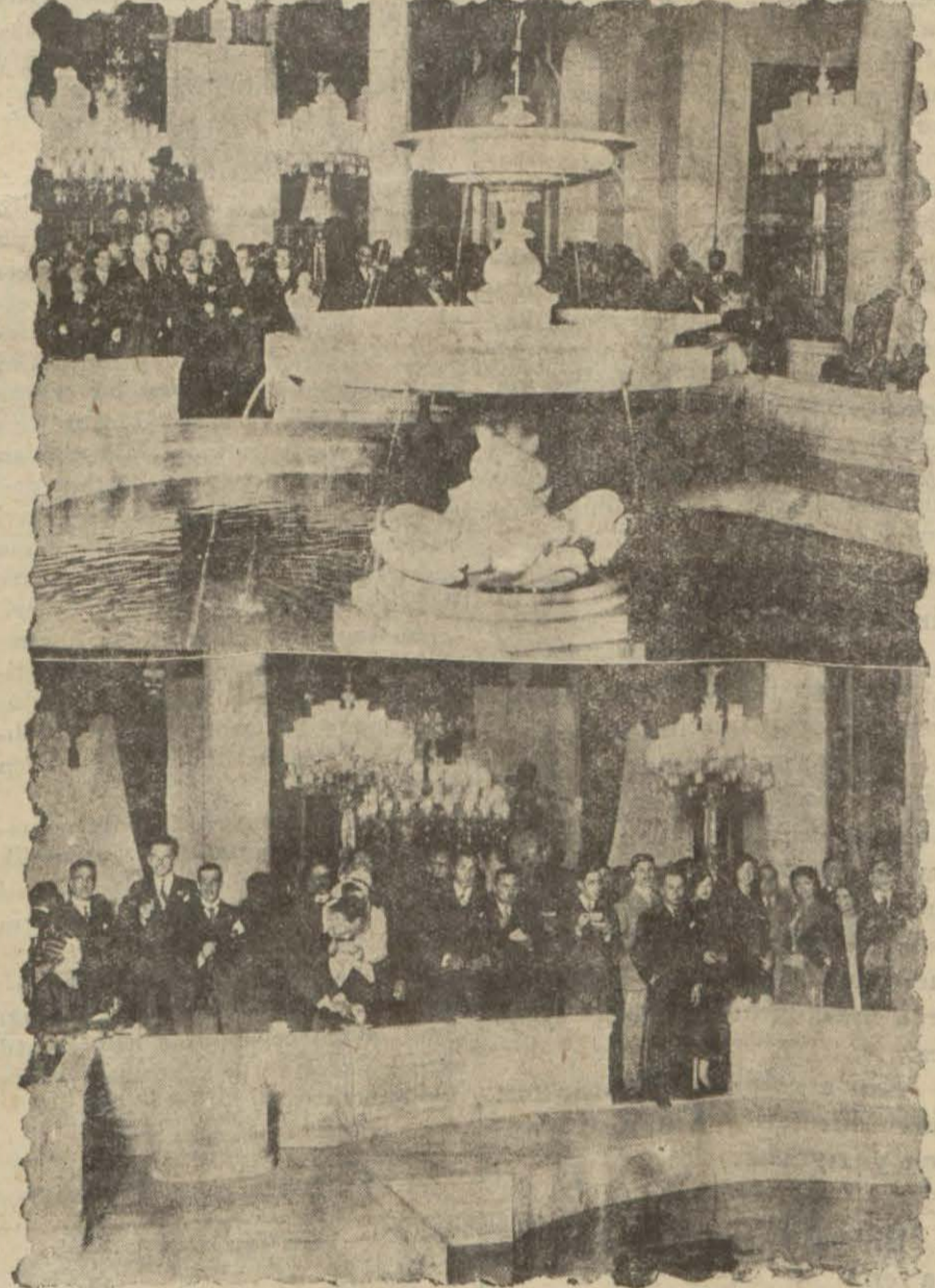
Murahasaların şerefine dün Beglerbeyi sarayına verilen çağ ziyafetinden iki itiba..

Boğazdaki gezintide balıklar misafirlere taze balık ikram ettiler.. zere altı Balkan hükümeti mümessillerinden mürekkep bir komite yapılmış ve Balkan memleketleri mük-