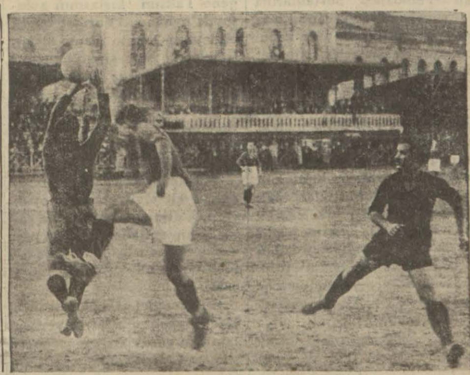
Muhtelit - kurtuluş maçından bir enstantene

siz İstasyonu tesis edilinceye kadar inkıtaya uğrayacaktır. Yarın sabah İskenderiyeden Kıbrıs'a bir miktar asker gönderilecektir. Kıbrıs abalisinin büyük bir kısmının Yunanistan'a iltihak arzusunda olduğu gayri resmi surette bildirilmektedir. Nicosiada vaziyetin çok vahim olduğu söylenmektedir. Bununla beraber gönderilecek kara ve deniz kuvvetleri geldikten sonra galeyana bastırılacağı zannolunmaktadır. İngiltere'nin Akdeniz filosu Suda limanında toplanmıştır. Filo başkumandanı Kıbrıs'a iki kruvazör ile 1400 asker ve zabıt göndermiştir. Bu kuvvetler yarın sabah Kıbrıs'a varacaktır. Aynı zamanda bir de asker nakleden tayyare gönderilmiştir.