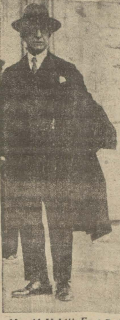
Maarif Vekili Esat Bey

Esat B. Haydarpaşadan doğru köprüye çıkmış ve ora-