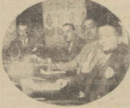
İstikbal programını hazırlayan heyetten bir grup