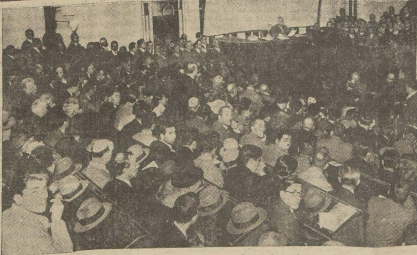
Dün konferans salonu her sınıftan halk ile hıncahınç doluydu..