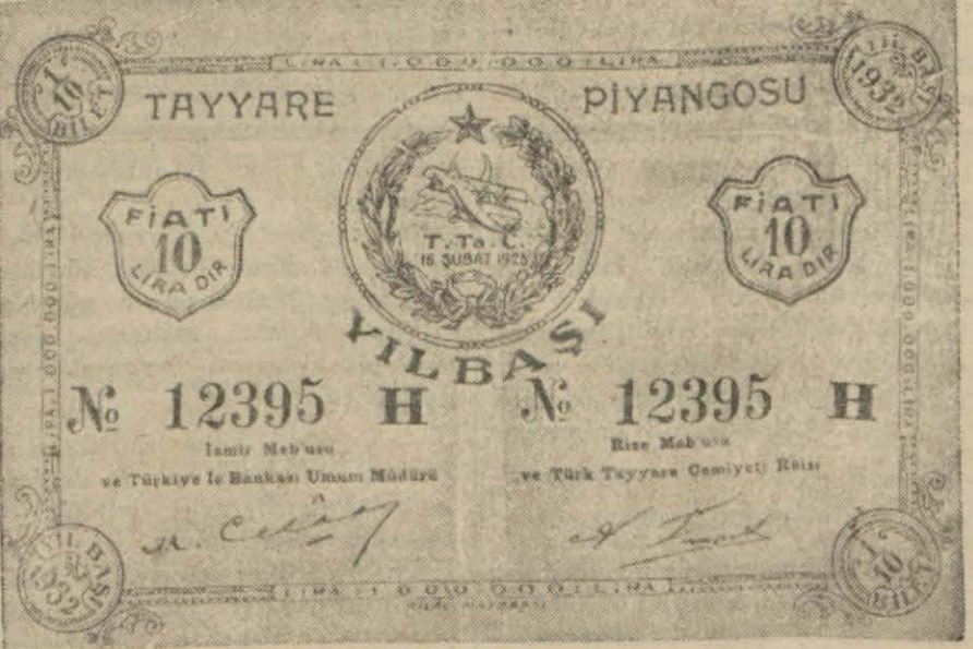
Tayyare piyango müdürlüğüne mak üzere tertip ettiği yılbaşı günün bir defaya mahsus olarak (Devamı beşinci sahifede)

Piyango müdürlüğü biletleri bugünden itibaren satışa çıkardı..