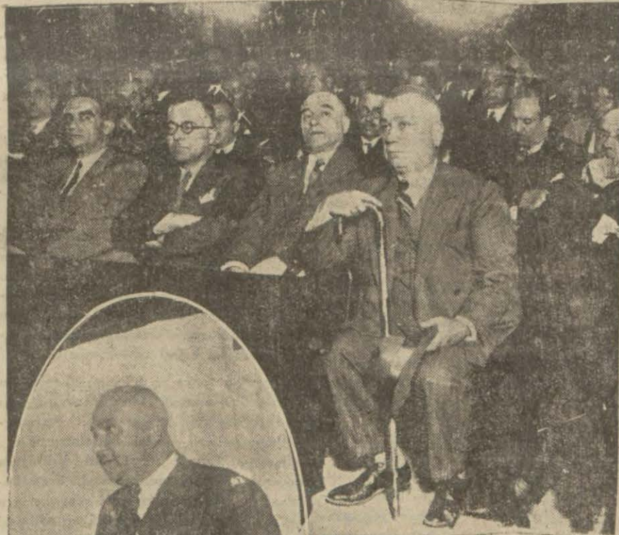
Konferansı dinlemeğe gelen Yunan gazetecileri. Solda Recep B. konferansını irat ederken

20 dakikalık müddet zarfında Recep Bey'e Yunan gazetecileri takdim edilmiş ve meslektaşlarımız pazar günü saat dört te görüşmek üzere Recep Beyden randevu almışlardır. 20 dakika sonra Recep Bey