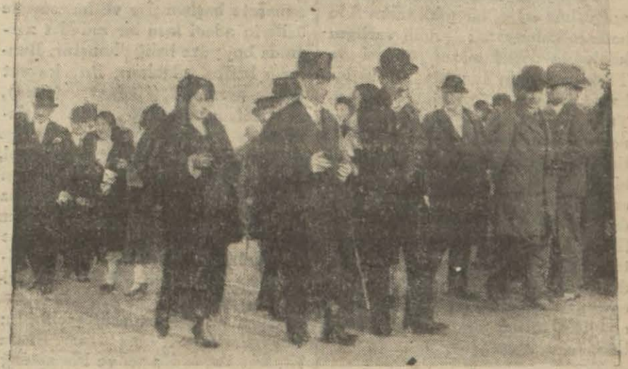
İsmet Paşa at yarışları yerini gezerken..