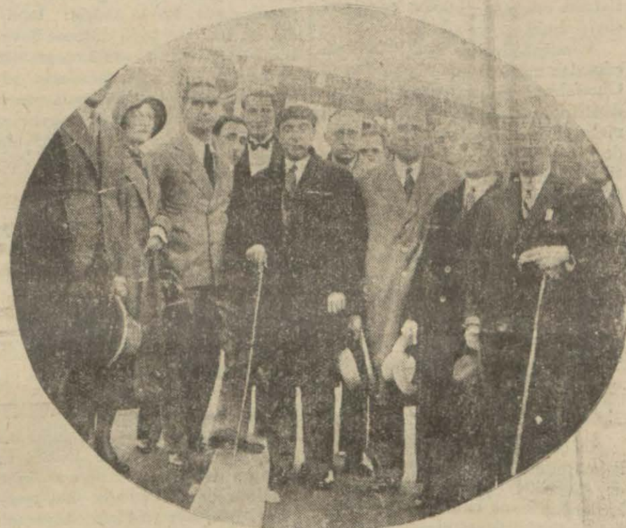
Misafir Yunan gazetecileri vapurda.

Şehrimizde toplanacak Balkan konferansına iştirak edecek olan Yunan murahhas heyeti ve gazetecileri, dün akşam saat on yedide, Ankara vapuru ile Pireden şehrimize gelmişlerdir. Yunan heyetinde İstanbul muhtelif teşekkülleri çok parlak bir istikbal resmi hazırlamışlardır. Bayraklarla süslenen Şirketi Hayriyenin 73 numaralı vapuru, istikbalcileri hâmilan saat 16 buçukta, Seyrüsefa'nın Tophane rıhtımından hareket etmiş ve o sırada limana girmekte olan Ankara vapurunu Sarayburnu açıklarında istikbal etmiştir. Ankara vapurunun grandî direğinde Yunan bayrağı vardı. İstikbale gidenlerin vapuru da Ankara vapuruna yaklaşıncaya, direğine Yunan bayrağını çekti. Yunan murahhas heyeti, Balkan Birli-