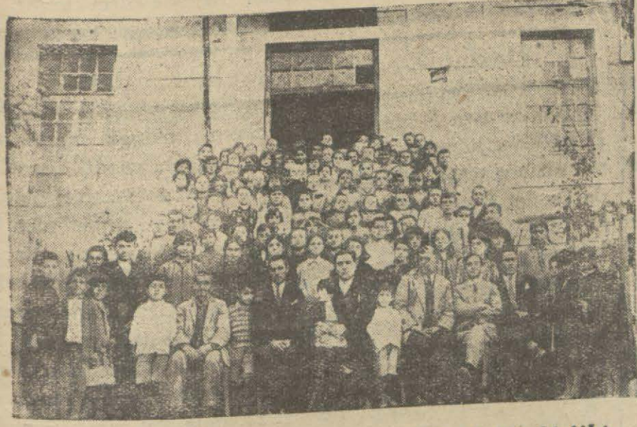
Orhanelinde mektep talebeleri muallimlerle birlikte

Bura ahali si hamiyet müsabakasında çok ileriye gitmiştir