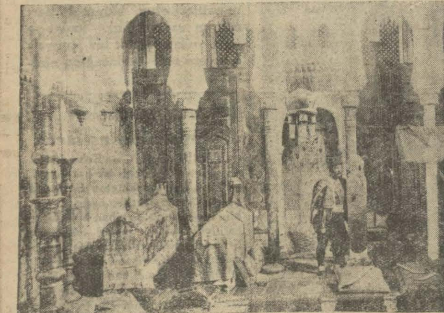
Loti'nin evindeki türbe

Denebilir ki burası bir ev değil, bir müze de değil, fakat bir âlemdir. Loti işte böyle bir âlemde içinde yaşıyordu.