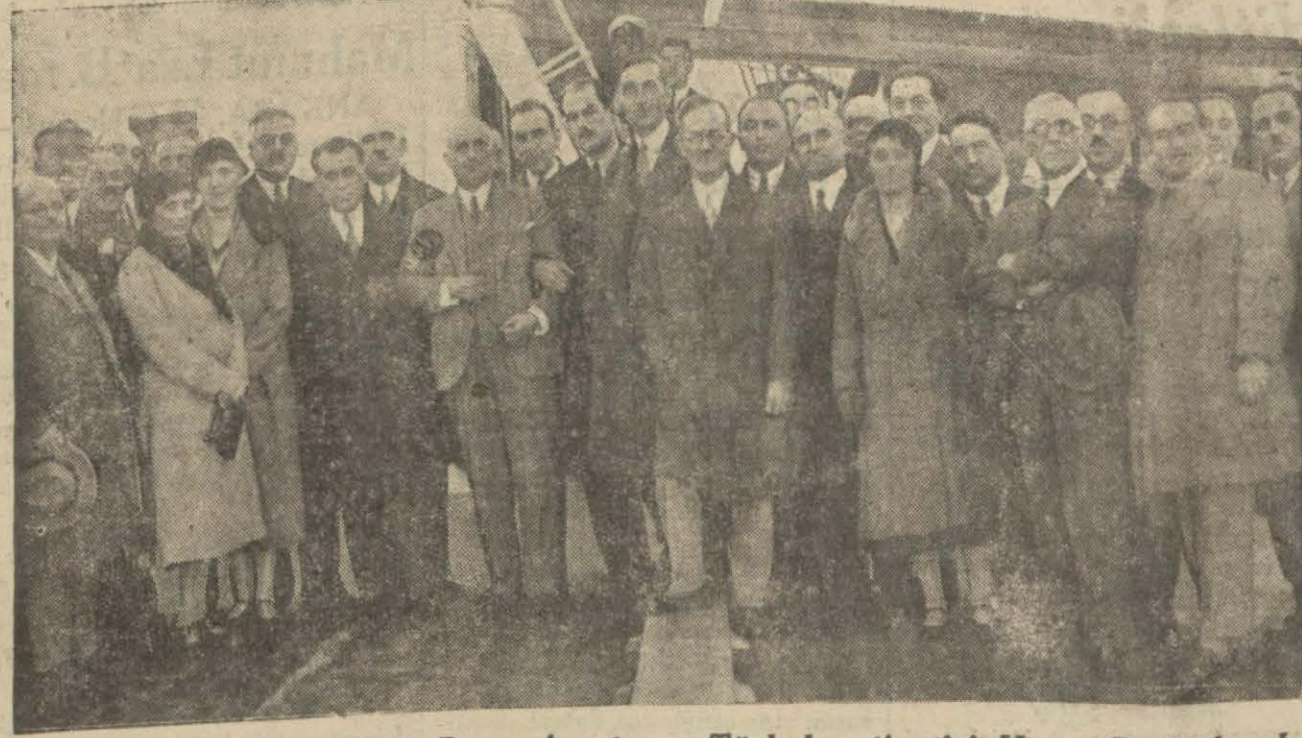
Yunan heyeti reisi mösyo Papa Anastasyo Türk heyeti reisi Hasan Beyle beraber