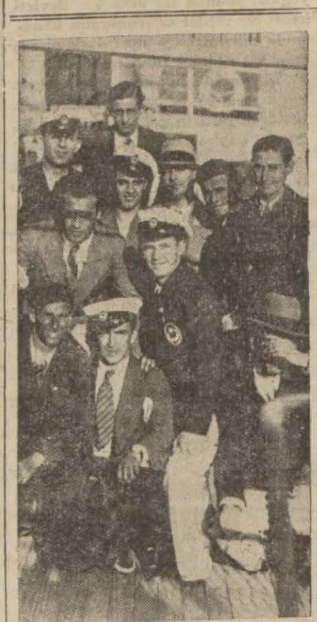
Yunanistana giden atletler dün geldiler. Resmimiz onlardan bir grup gösteriyor. Yazısı spor sütunlarımızdadır