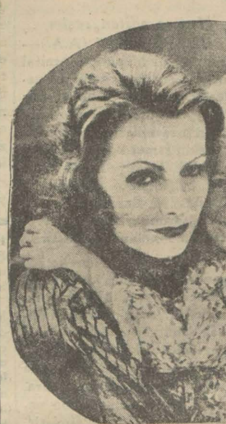
Greta Garbo sade zevkleri, çocukları ve denizi sever

ne budala insanlar! Evet, çok dışarıya çıkıyorum. Çünkü yorgunluğum bana kâfi geliyor bir az evimde dinlenmek istiyorum. Dışarıya çıkmak ta bir nevi yorgunluktur.