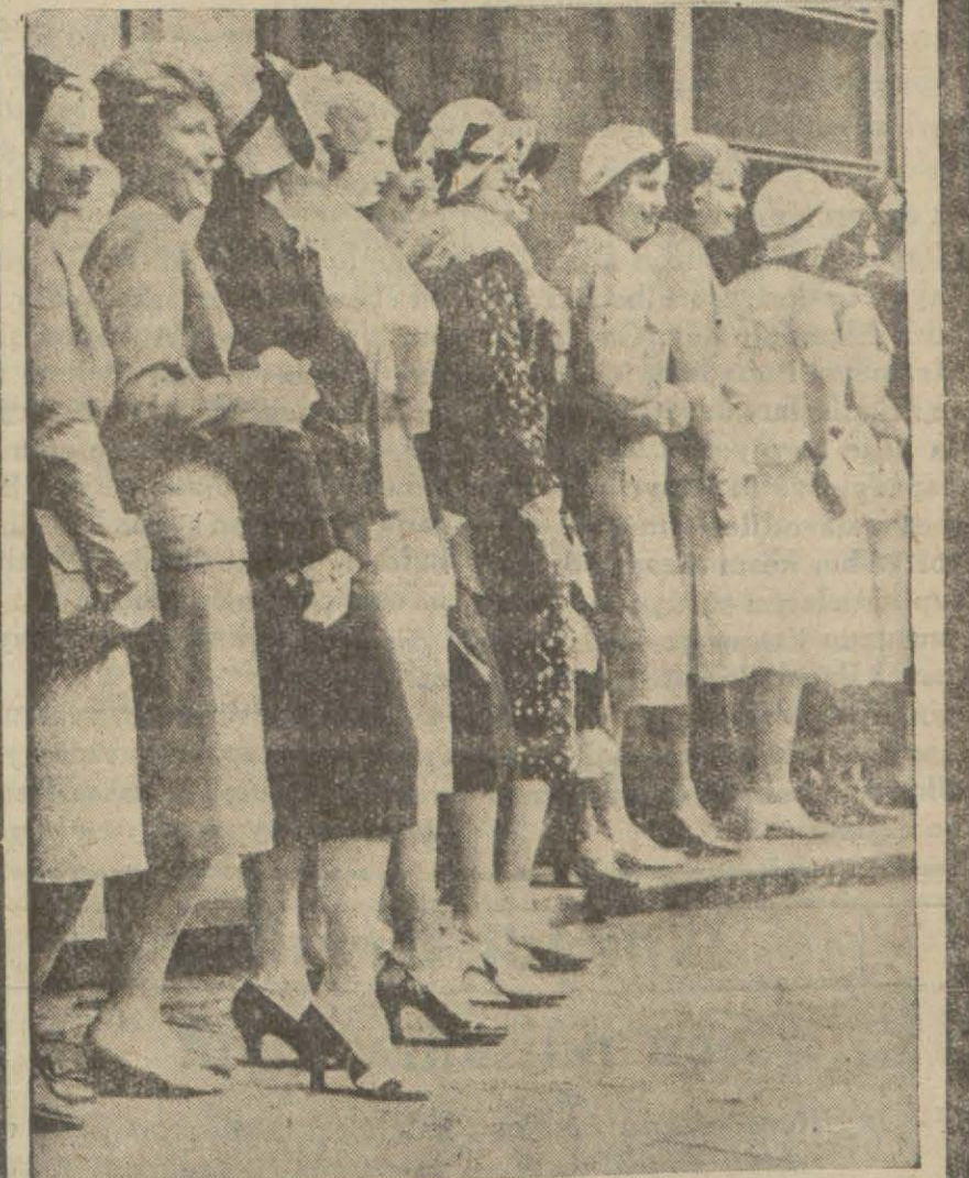
Bir stüdyo kapısında iş arıyan kızlar

Sinmayı uzaktan görenler sinema âlemini binbir gece masalları şeklinde tahayyül ederler. Halbuki sinema alıp yürüyeli bu âlemin sineması değişmiştir. Çünkü para, kadın ve aşkın girdiği yere bittabi hırs ve intrika da girmiştir.