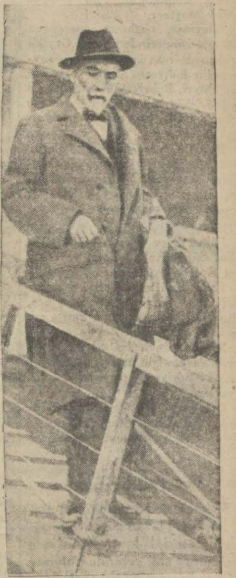
M. Montagu Norman

Bu son vazifesi dolayısıyledir ki, İngiltere Bankası ile münasebatı daha sıkı bir hale geldi. İngilterede para buhranı gittikçe hat bir hale gelin-