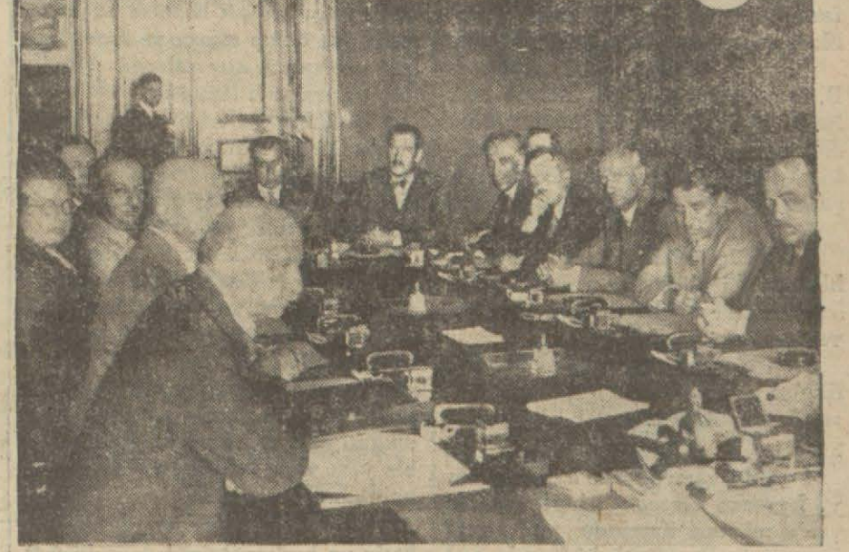
Balkan konferansının İstanbul hazırlık içtimalarından