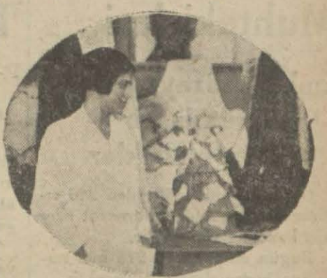
Sergiden bir köşe

Divanyolundaki Türk kadınları biçki yurdu sergisi bugün kapanıyor. Sergiyi şimdiye kadar gezenler çok memnuniyet izhar etmişler ve yurt mezunlarının bu seneki elişlerini çok beğenmişlerdir.