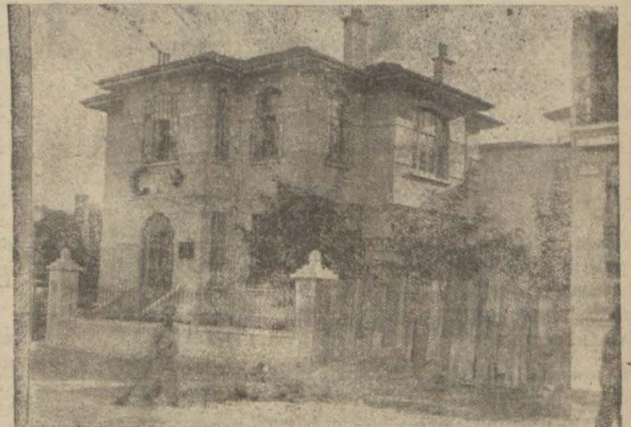
Cağaloğlundaki Verem dispanseri

kazanmıştır. Dün sabah Berlinden gelen bir habere göre Berlin Ticaret ve Sanayi odası böyle ecnebi kambiyo ile tediyat meselesinde tahaddüs edecek ihtilâfların halli için bir büro açmıştır. Bu büro her ihtilâfın halli mukabilinde 20 mark almaktadır. Alâkadarlar bizde de böyle muvakkat bir teşekküle ihtiyaç göstermektedirler.