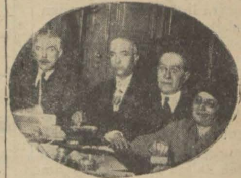
Encümeni daimiden bir köş