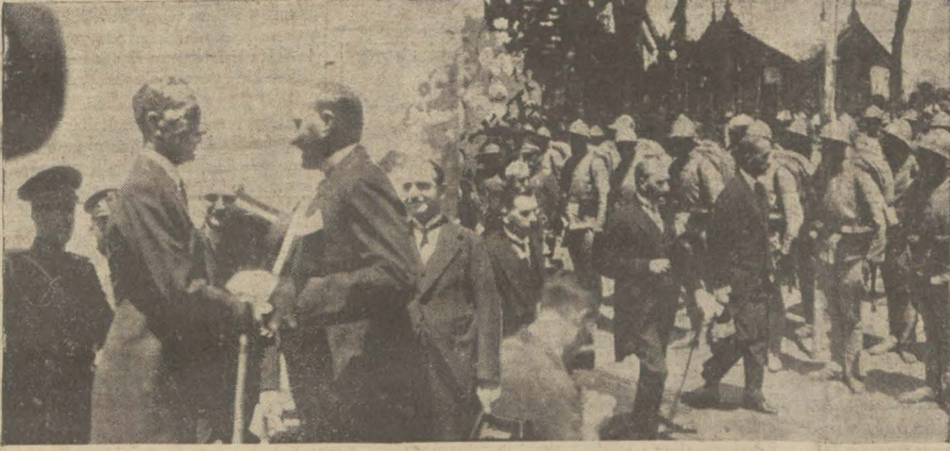
Kral Feysal Hz. istasgonda Reiscümhur Gazi Mustafa Kemal Hz. ne mülaki olduğu esnada ve rasime salâmı ifa eden Türk kıtaatının önünden geçerken.