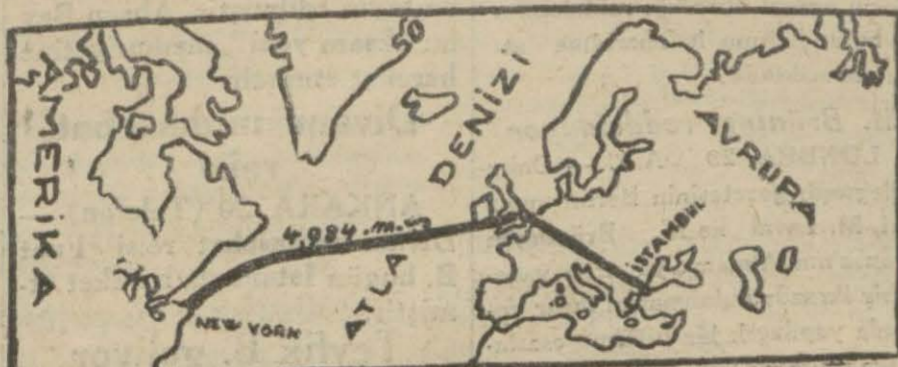
49 saat 18 dakikada 4884 millik mesafe bu haritada gösterilen hava yolu ile katedildi