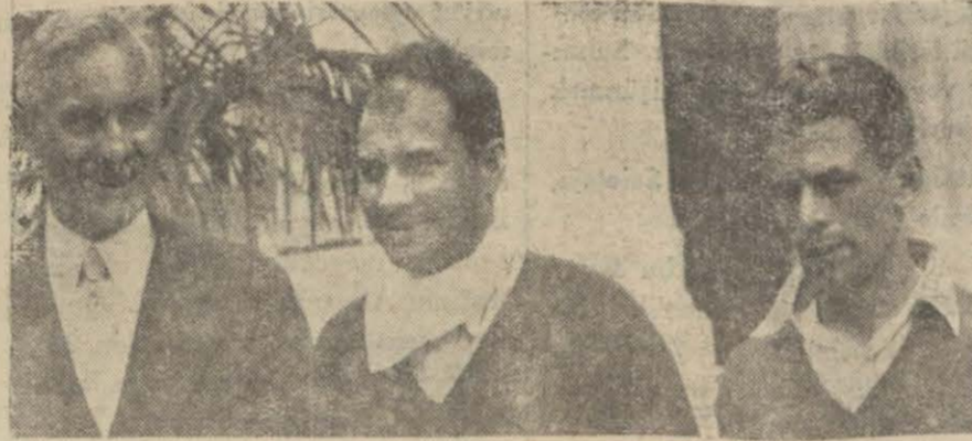
Büyük ve harikulâde bir hava hareketinin kahramanı olanlar tayyareden çıktıktan sonra..

İki gündür İstanbul fevkalâde hava hadise ve hareketlerine şahit oluyor. Binlerce kilometrelik mesafeleri Bahrimuhitleri bir hamlede uçan beynelmül büyük tayyareciler hep şehrimizde toplandılar. Pelletier Doisy, Arrachard, Costes buradadır, Şimdi de 49 saat 18 dakikada cihanı dolduracak ve hava kahramanlığına yeni istikametler ve