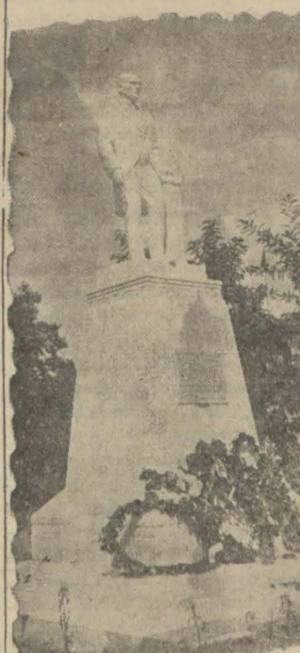
İspartada Gazi hegakelinin küşad resminin yapıldığı haber vermiştik. Resmimiz hegakeli göstermektedir

Dün Millî Hakimiyet bayramı münasebetiyle şehirimizdeki bütün daireler kapalı bulunuyordu. Türk Maarif cemiyeti zarif bir şekilde tabettirdiği Maarif cemiyeti rozetlerini tevzi ettirmiş, tahtilden istifade eden bir çok memur aileleri bayramı sahillerde ve mesirelerde geçirmişlerdir.