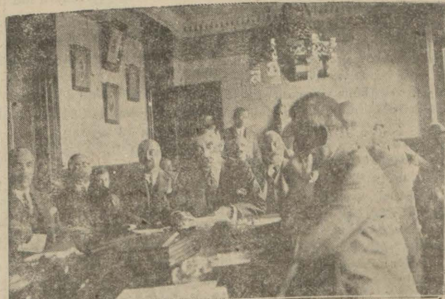
Hissedarlar meclisinin umumi içtimasından bir köşe

Hey'eti umumiyenin dünkü içtimasında idare meclisine salâhiyet verildi