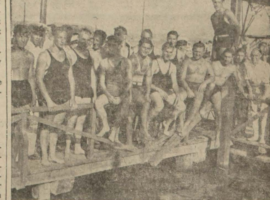
Dün, şehrimizde bulunan Amerikalı darülfünan talebesi ile yüzücülerimiz arasında yapılan yarışlarda Amerikalılar mağlûp oldular. - Yazısı spor sütunlarımızda -

Büyük harbin ilk günlerinde (Devamı 6 ncı sahifede)