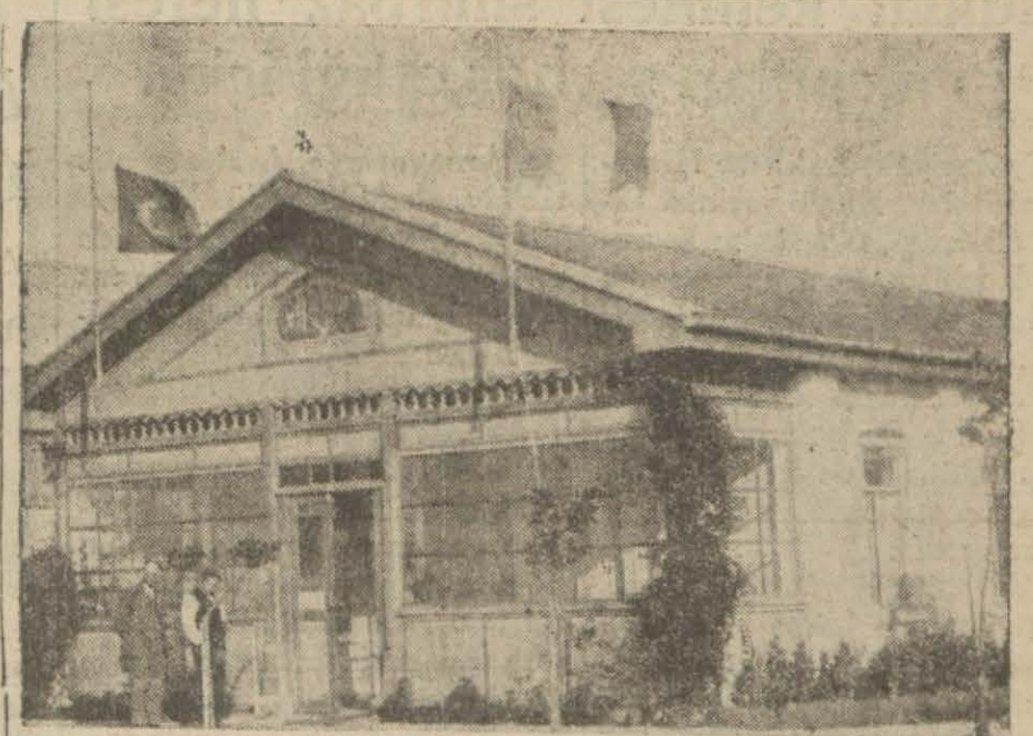
Dün Yeşilköy tayyare karargâhı bayraklarını yarıya kadar indirmiş, hava golcularının matemini tutuyordu..

Bugün gazetemizde mündericatin pek ziyade fazlalığı dolayısıyla "Matbuat celsesi" zabıtlarını neşredemedik.