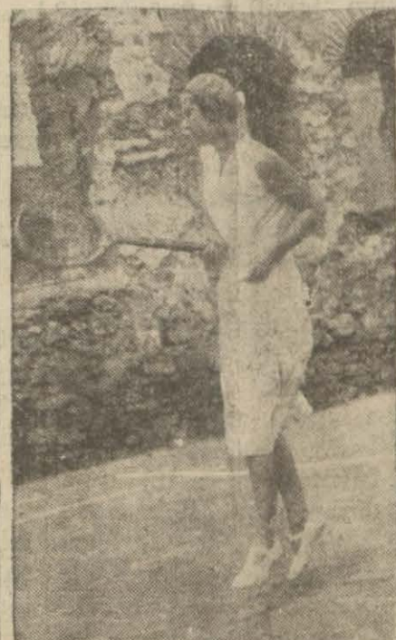
Tennis turnuvası muva-fakiyetle ve heyecanla devam ediyor. Yaşını spor sütünlarımızda takip ediniz

ANKARA 26, (Milliyet) — Ziraat bankası lüzumu takdirinde buğday çiftçisine yardımını bir miktar daha tezyit edecek-tir. Buğday çiftçisinden borcu-na mukabil alacağı buğdaydan maada köylülerden buğday satın almacaktır. Ve himayeye muhtaç köylüleri kredi nisbetini arttıracaktır. Banka bu husustaki faaliyeti için evvelce 5 milyon lira tahsis etmeyi takarrür ettirmişti. Bu mikdarı sekiz milyon liraya kadar çıkarabilecektir.