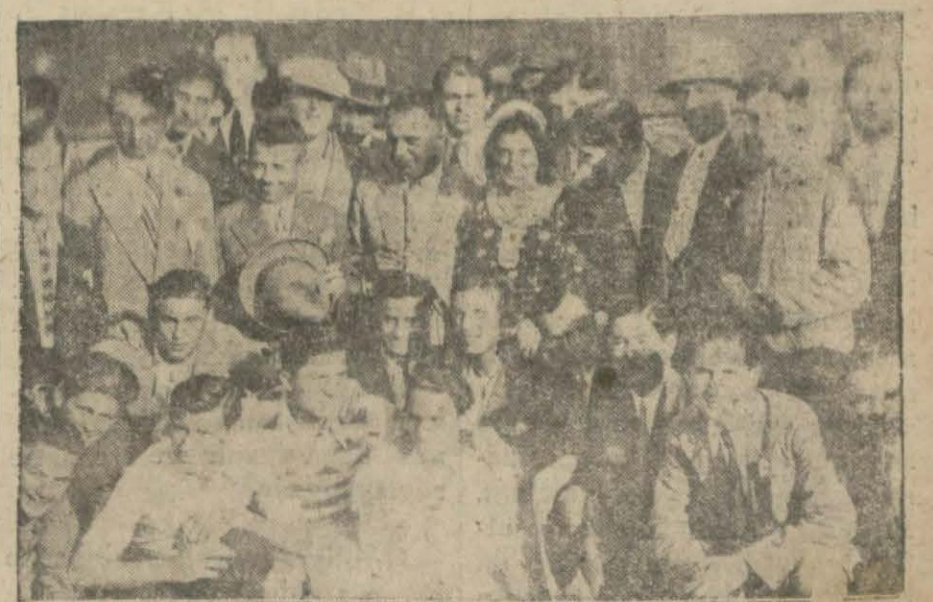
Dün İzmir giden İstanbul sporcuları rıhtımda.

Bir kaç seneberi bizim kafaları boş olduğu kadar başları da boş kalmasını isteyen sokak politikacıları, uğraşa, uğraşa, (Devamı beşinci sahitede)