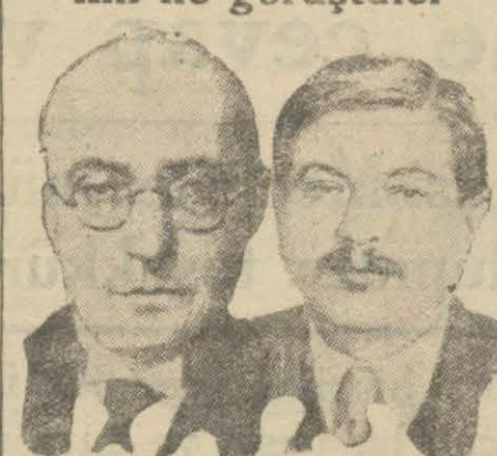
Alman Başvekili Brüning ve Fransız Başvekili Laval

Pariste Fransız Başvekili ile görüştüler