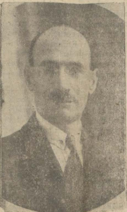
İktisat vekili Mustafa Şeref Bey

İş kanunu Rüşti B. bundan sonra gelecek devrede iş ve teşvikî sanayi kanunu lâiyhalarının kendi ihtiyaçlarımızı