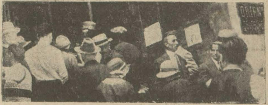
Doçye Oryent Bank'a para almak için vuku bulan tehacüm intibaları

Bugün fırkaya tekrar gelen ve amele mümessilli olduklarını iddia eden ve biraz da vaziyeti karıştıran bu arkadaşlara lâzım gelen tavsiyede bulunum. Meselenin bu, ehemmiyetsiz kısmı, Hamdi Beyin Ankaradan avdetinde şirketçe tabii bitirilmiş lacaktır. Bunda üzerinde durulacak haizi ehemmiyet bir şey yoktur.