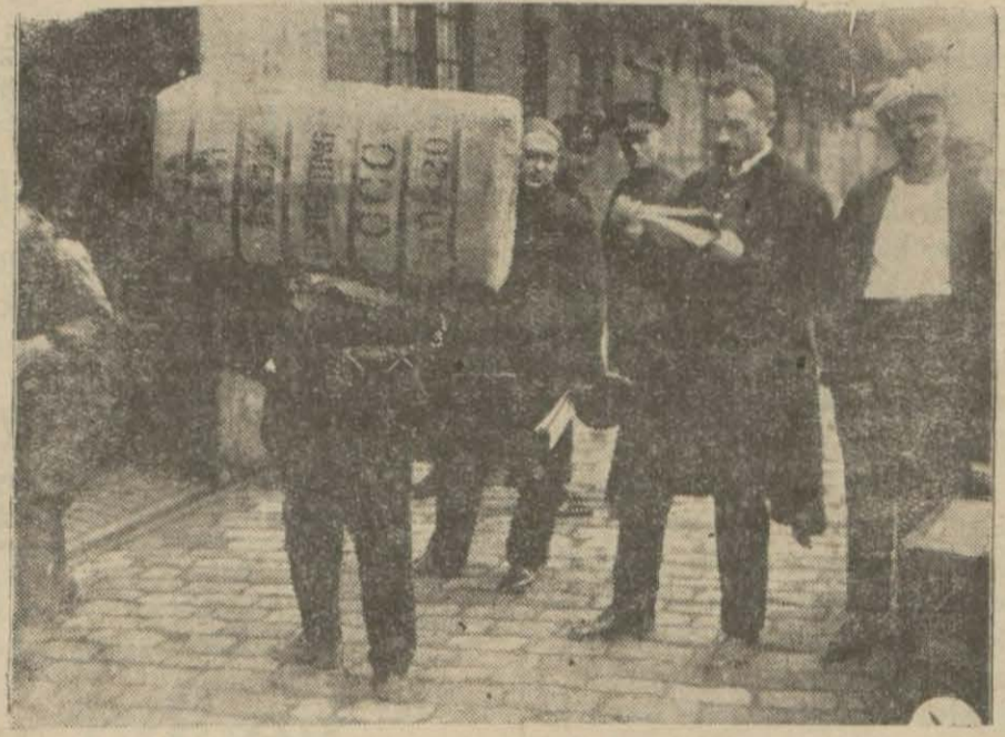
Maliye vekâletinden sonra en ziyade memurları arasında tasfiye yapan dairelerden biri de Gümrüktür. Gümrükte bilhassa muayene memurları arasında açığa çıkacak olanlar epeyi gekün tutmaktadır

Meselenin esasında haizi ehemmiyet bir şey yoktur. İş azası, bir adet kütüphane me-muru, tahrirat ve evrak müdürüğü kâtipi mushafklar tetkik