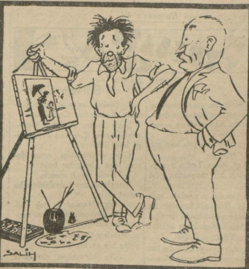
— Resim güzel olmuş ressam! Başka yapılacak bir şeyi kalmadı değil mi? — Ah bilâkis... En güc iş bundan sonra: Beyendrip satabilecektir!