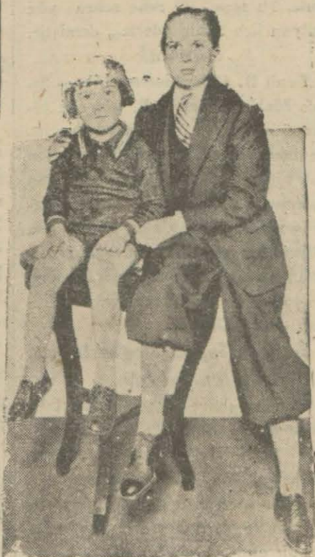
Jackie Coogan ve kardeşi