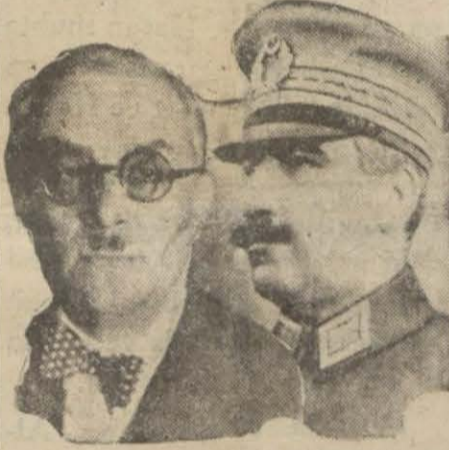
İş Bankası U. B. Erkânı Harbiye Müdürü Reisi Müşir Celâl Bey Fevzi Pş. Hz.

rat ile askeri mektep talebesine ailelerinin gönderdikleri paralar da keza meccanen naklolunacaktır.