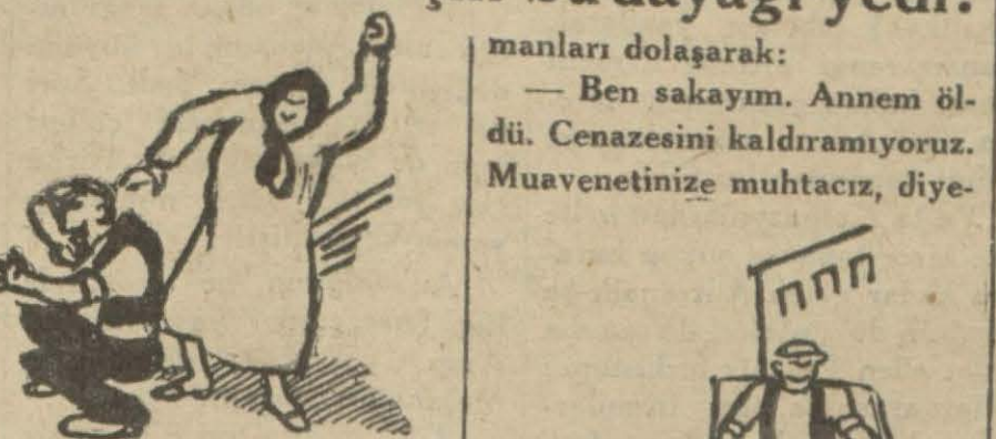
Vah.. vah.. hasta öldüde onun için..

manları dolayarak: — Ben sakayım. Annem öldü. Cenazesini kaldıramıyorum. Muavenetinize muhtacız, diye-