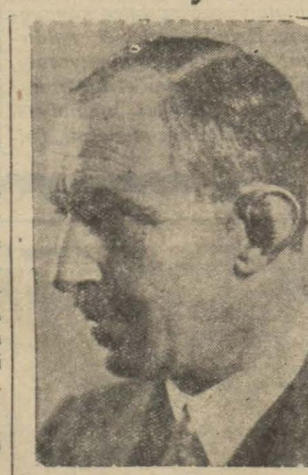
Fazıl Ahmet Bey hepsi de hem doğru, hem yan-lıs.

Aşkı bin türlü tarif etmek mümkün. Ve tariflerin hemen