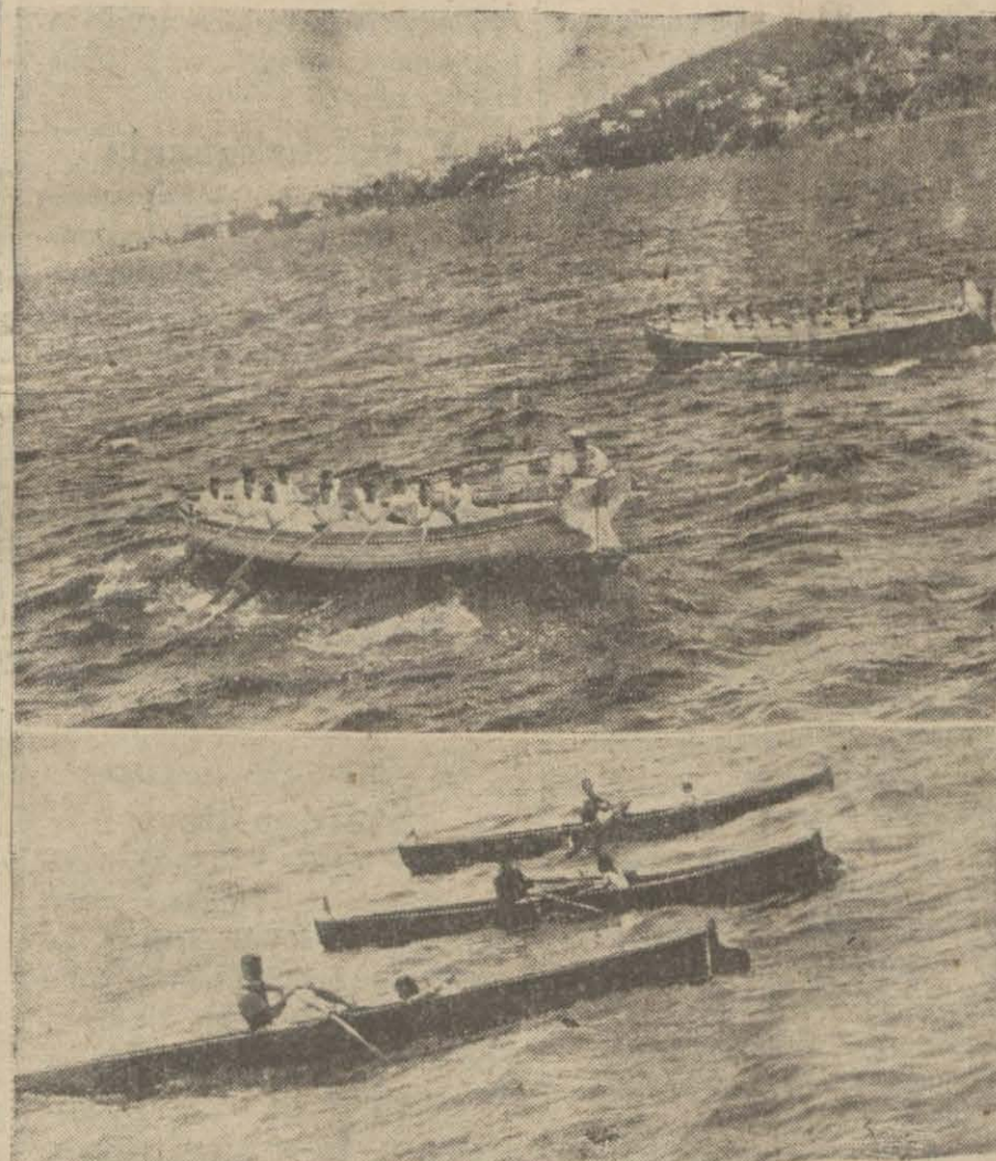
Yukarıda Deniz harp mektebi ve Deniz lisesinin altı çift flikalarının garışa çıktığı, aşağıda tek çift klüp fitaları müsabakası

neviyatı üzerinde tehlikeli oyunlar oynamalarını hoş görmeyişlerimizin sebebi, kalem ve fikir hürriyetine hümmetsizliğimizin değil, böyle bir oyun neticelerini iyi gördüğümüzdür. Bolşevik propagandasının gayeleri sarıhtır. Onlar, yıkmak istedikleri iktidarın yerine hangi rejimi oturtmak istediklerini açık söyleyorlar. Perestijini mütemadiyen kırmağa çalıştıkları hükümetin,