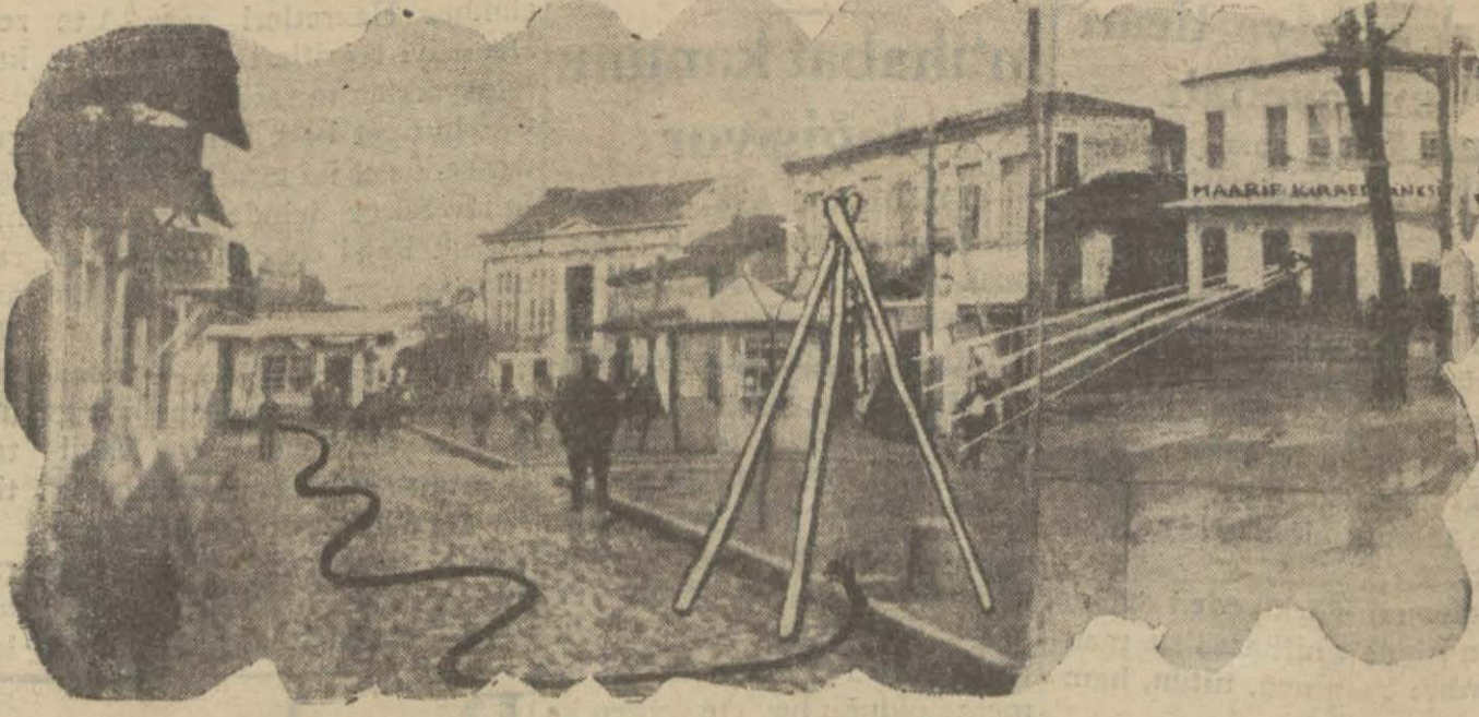
Bozalanlı Hüseyin'in sehpa getirilisi muhabirler tarafından Maarif kiraathanesinden seyrediliyordu. Bir silâh patladı ve bir karışıklık oldu. Kaçışıyor ve koşuşturuyorlardı. Bu kaçan Hüseyin ve divanharp tahsis olunan Kubilây mektebi istikametine doğru koşuyordu. Bu kroki muhabirlerin telgraflarına göre idam mahkûmu haydutun nereden ve nasıl kaçtığını gösteriyor