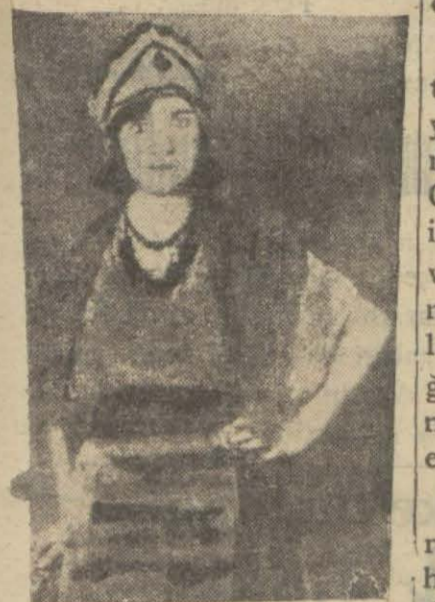
İntihara kalkıştı. İki kız elbirliğile intihara kalkıştı. İki kız elbirliğile intihara kalkıştı.

İki bir fincan aldı. Ben de bir şişe su. Eczaneye gittik. Eczacıya: kuruluk tentirdiyot bir insanadır mı, diye sordum. Eczacı