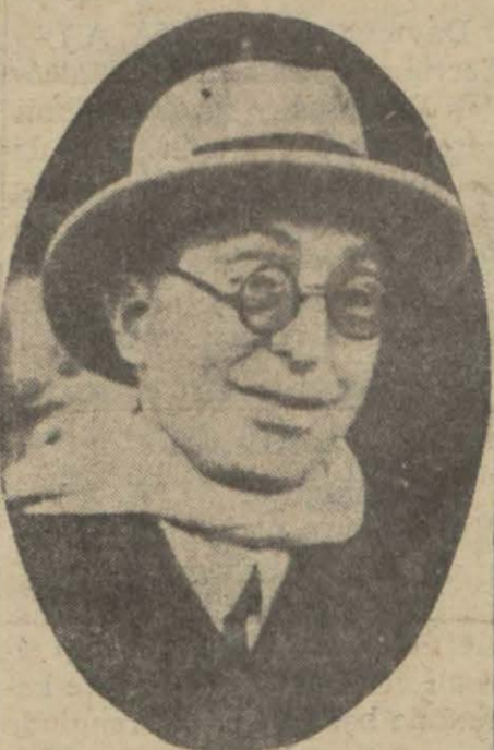
Tevfik Rüştü Bey

Bükreş, 2 (Apo.) — Roman-ya hükümeti, Türkiye Hariciye Vekili Tevfik Rüştü Beyi Bükreşi ziyarete davet etmiştir. Bu ziyaretin önümüzdeki hazi-