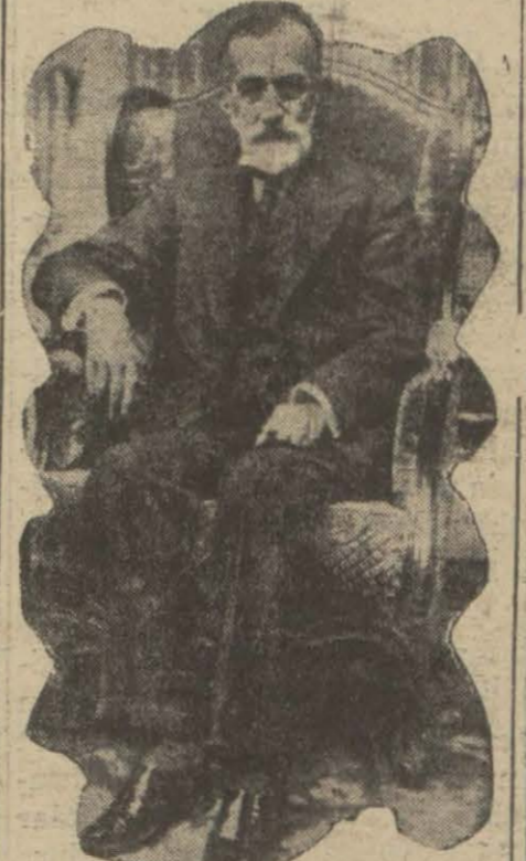
Bugün 78 yaşında giren büyük şair Abdülhak Hâmit Bey

1268 hicri ve 1852 milâdi senesinde doğan Büyük şair Abdülhak Hâmit, bugün 77 yaşını ikmal ediyor. Hayatı büyük firatın arasında geçen bu ebedî genç, ölmek için doğmuş bah-