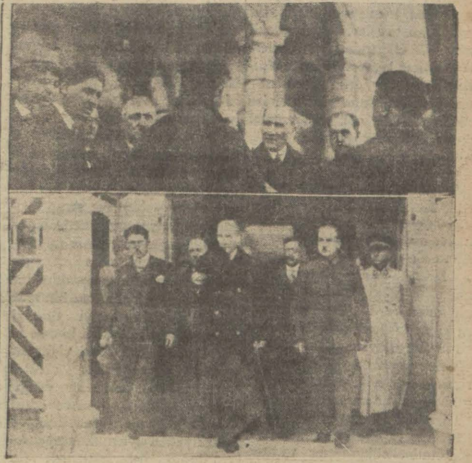
Reisicumhur Hazretleri Mevki müstahkem Kumandanlığından çıkıyor ve bir istidayı kabul ediyorlar

Haber aldığımız göre, (40) kuruş kadar maaş alan eytam ve eramilin on seneliklerinin tevzi-ne başlanmak için zat maaşları muhasebeciliğine Maliye Vekâletinden emir gelmiştir.