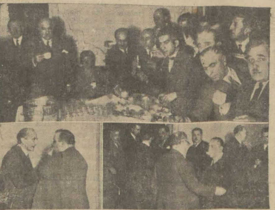
Dün ehemmiyetli bir celse akdeden C. H. F. İstanbul vilâyet kongresinden iki intiba: celse arasında, büfede.

Fırka teşkilâtı için hey'eti idareye salâhiyet verildi; irşat hey'etleri teşkil edilecek