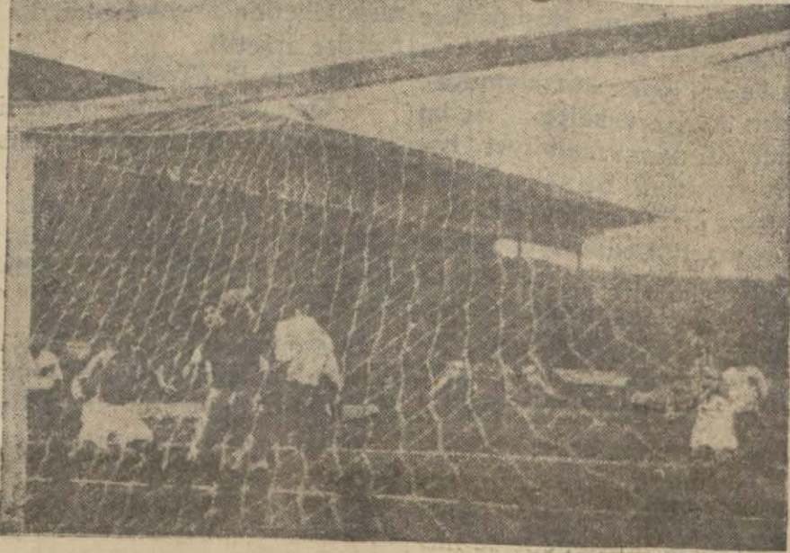
Fransız kalecisi müşkül mevkiide.

İtalya millî takımı ile Fransızlar, geçen hafta karşılaştılar. Netice malûm, İtalyanlar, rakiplerini bir silindir gibi ezdiler.