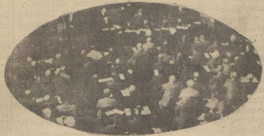
Büyük Millet Meclisinin içtimamından bir intiba