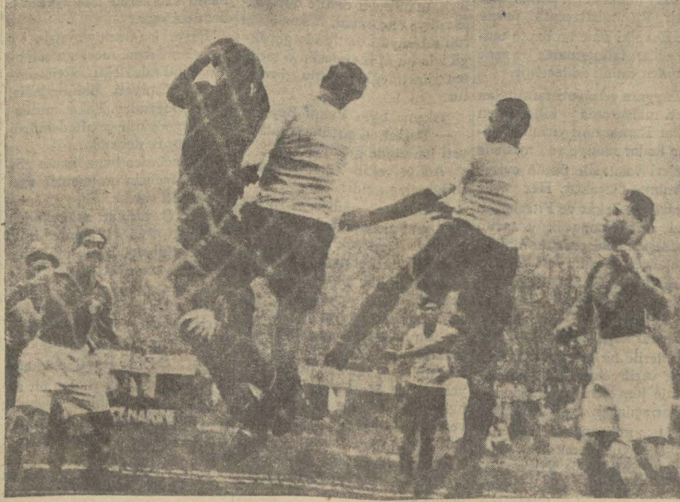
İtalyan mühacimleri Fransız kaleci önünde.

Fransız millî takımının (5-0) yenilmesi İtalyan Federasyonunun pratik çalışmasındandır