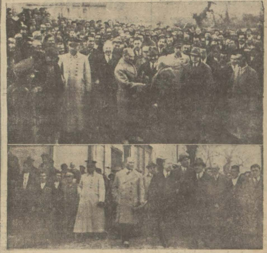
Reisicümhur Hz. nin Kemalpaşa kazasında ve Armutlu köyünde çekilen iki fotografileri

Heyeti vekilenin gene evvelki günkü içtimamında yeni masraf bütçesinin tetkikatı yapılmış tir. 931 masraf bütçesinin 176 milyon lira olması esası takarrür etmiştir. Bu suretle geçen seneki bütçeye nazaran 46 milyonluk bir tasarruf olmuştur.