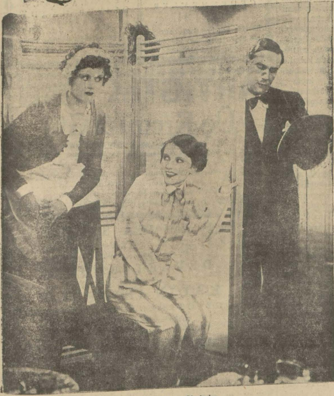
"Kuyruklu yıldız" filminden