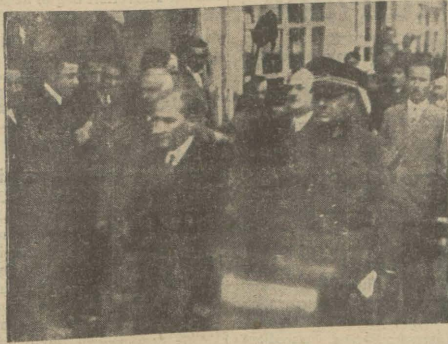
Gazi Hz. nin son seyahat intibalarından..