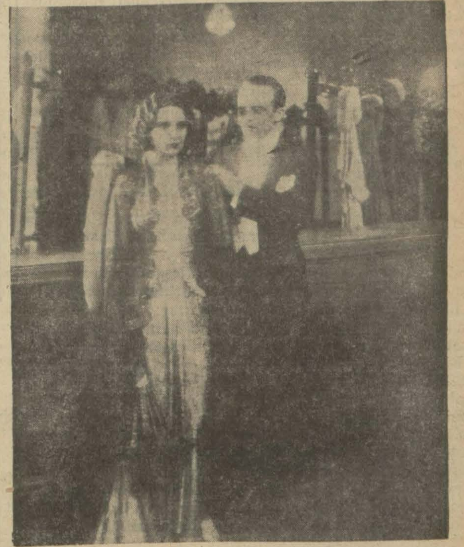
"Öldüren Adam" filminden

(Emil Jannings) "Ernest Lu bitsch" in idaresinde çevirmek