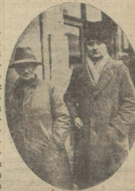
Magruk vapurların güçöl ile kurtarılan kaptanları

Evvelki gün Karadeniz ve Adalar denizinde siklon tarzında vuku bulan şiddetli fırtına bahri bir felâket şeklini almış ve Karadenizde Anadolu Karaburnu civarında karaya oturdularını yazdığımız, İngiliz bandıralı Trevcan ve Welfield vapurlarından başka, biri Akdeniz de olmak üzere daha dört vapurun karaya düşerek parçalanmasına sebep olmuştur. Trevcan ve Welfield'in mürettebatından elli sekiz kişiyi kurtararak evvelki akşam, Büyükdereye getirmiş, mütebaki on on beş yolcu va tayfaları da dün tahliye memurlarımız tarafından kurtararak Kara burundan yük arabalarıla Buzhane mevkiine ve oradan da otomobil ile Beykoza nakledilerek İngiliz konsoloshanesine teslim edilmiştir. Werfield karine