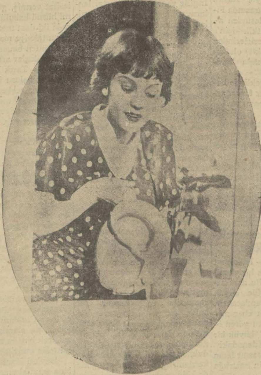
"Kuyruklu yıldız" filminden