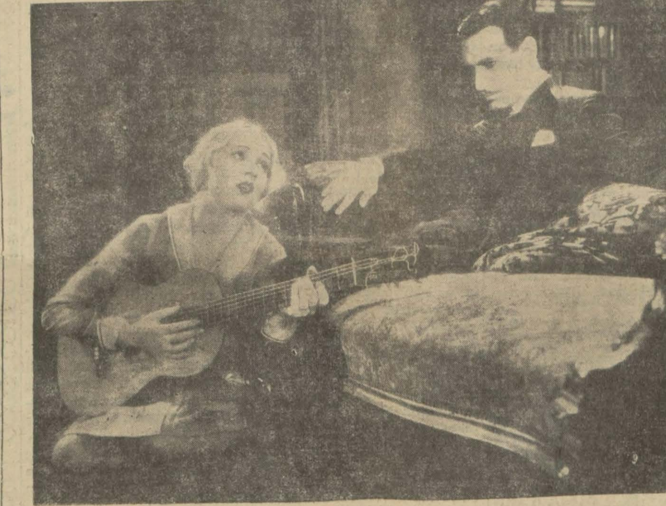
"Üç kırmızı gül" filminden

İstanbulda İngiliz dayınler ve kili M. Flakland isminde haşin ve ters bir İngiliz var. Bunun bir de güzel karısı var. Kadına Fransız ateşe militeri olan kaymakama âşık oluyor. Kadın kocası tarafından fena muameleye maruz kalmaktadır. İngiliz karısını birisile gayri meşru münasebet