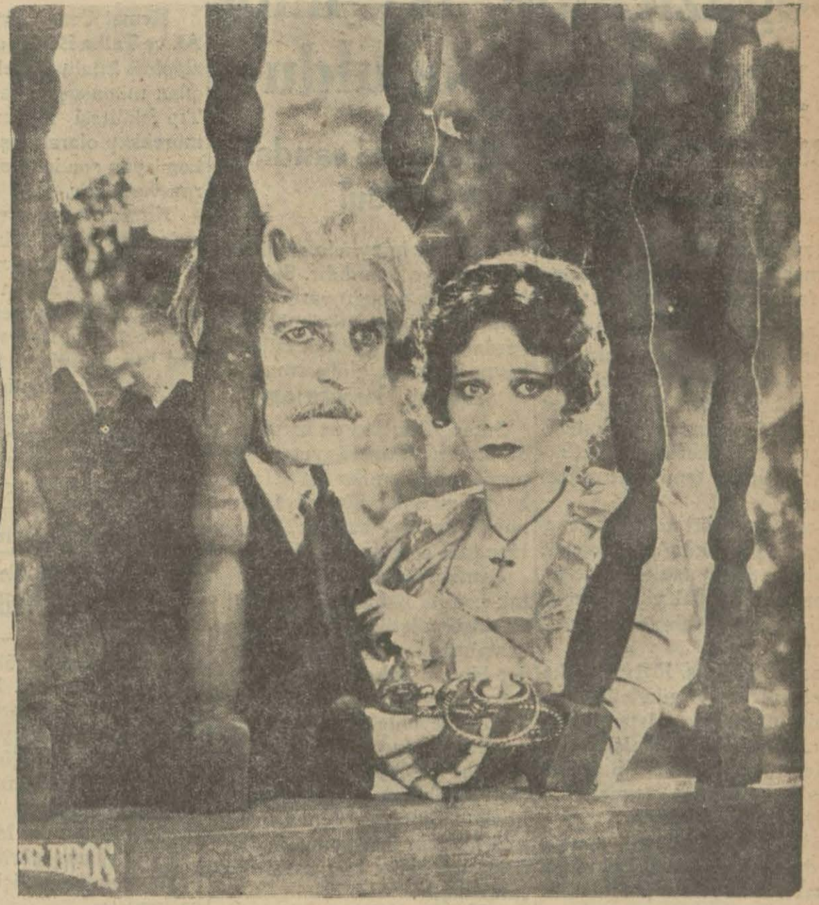
"Cehennemler hâkimi" filminden