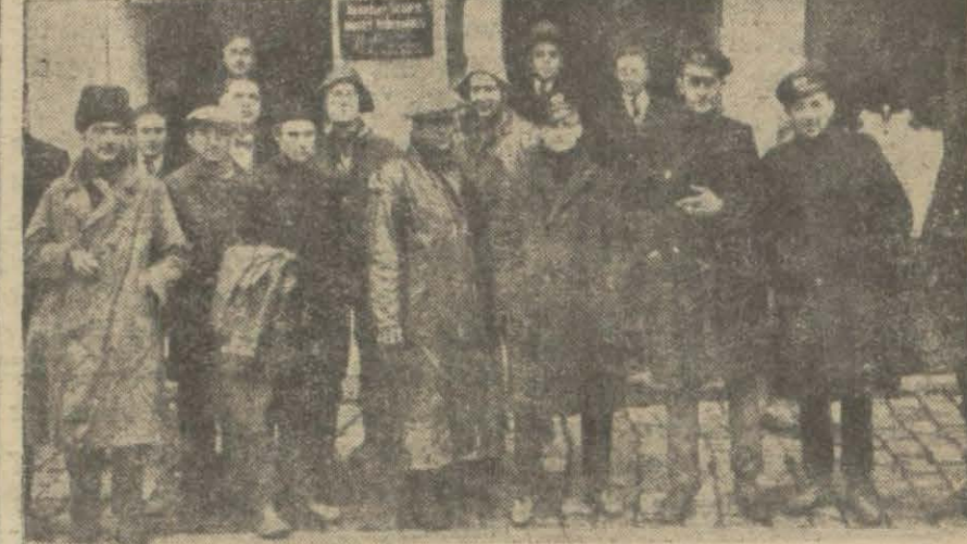
Şehrimize getirilen magruk vapurların tayfalarından bir grup

Cenazesinde vali Muhiddin, İstanbul meb'usu Edip Servet Beylerle bir çok doktorlar hazır bulunmuştur. Mezarı başında Edip Servet B. bir nutuk söyleyerek mumaileyhin büyük hizmetlerinden bahsetmiştir.