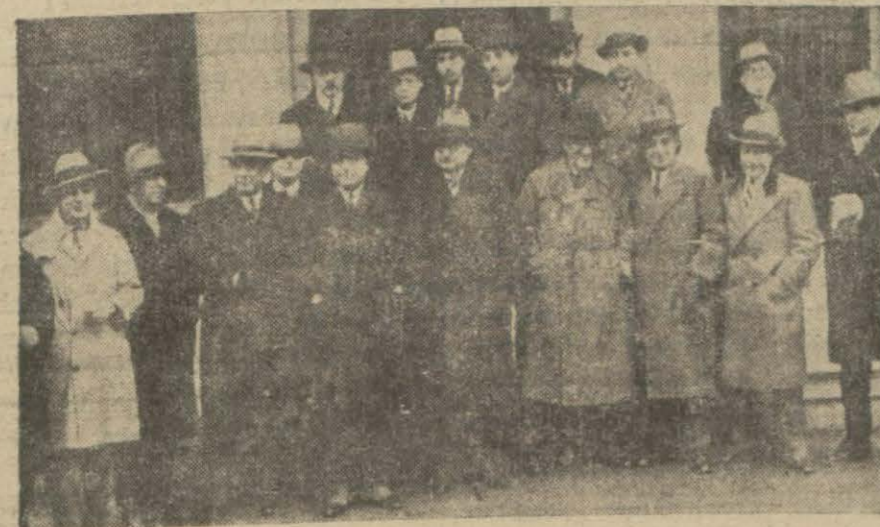
Matbuat kongresinden çıkan bir grup..

Bundan sonra Mevlevî tarikatinin banisi Mevlânâm ve Şemsi Tebrizinin serpuşları tetkik edilmiştir. Bilhassa Şemsi Tebrizinin serpuşu Gazi Hz. nin hayretini celbetmiştir.. (Devamı 2 inci sahifede)