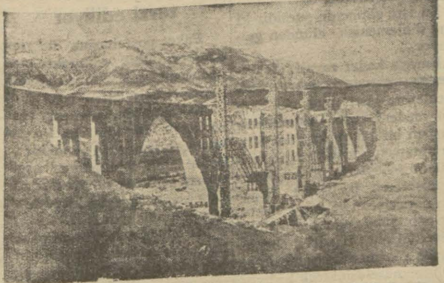
Fevzipaşa - Diyarbekir hattında yapılan muazzam bir köprü