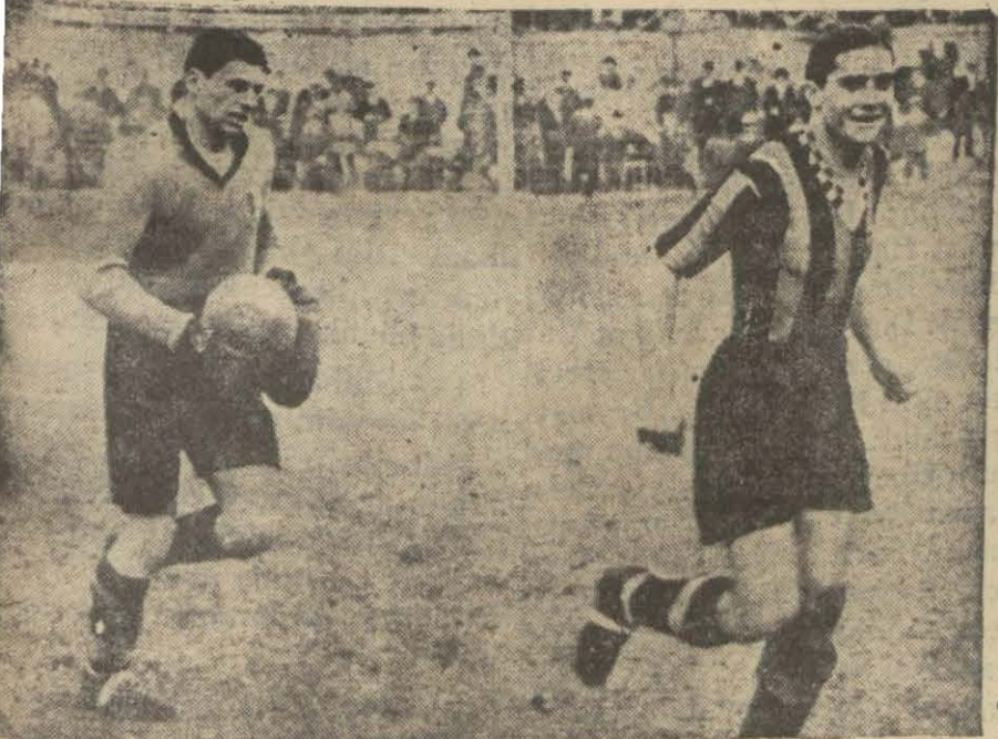
Pek kısa zamanda çok ilerleyen İtalyanların merkez mühacim meşhur Meazza sahaya çıkarken

Faaliyetin merkezi sıklıkla mekteplere çevirmek de çarelerden biridir.