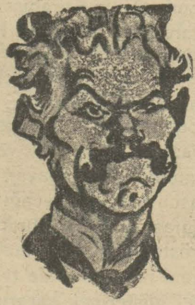
Mr. Mac Donald

Gelen telgraf haberleri arasında İngiliz kabinesinin vaziyetini gösteren haber var. İngiliz kabinesi, yani mesai fırkasının hükümeti olan Mac Donald kabinesi aleyhine kadim muhalif muhafazakâr fırka birkaç kere muahaze takriri vermiştir. Fakat her defasında bu taktir parlamentoda reyeye konulduğu zaman ahrar fırkasının mesai fırkası azasının hükümeti muahazere etmesinde red edilmiştir. Şimdi tekrar böyle bir taktir verilmiş oluyor. Eğer bu sefer ahrar fırkası muhafazakârlara itiraz ederse amele hükümetinin istinat ettiği amele fırkası meb'usları ekalliyette kalması olacaktır. Bu takdirde hükümet parlamento tarafından muahaze edilmiş oluyor demek ki kabinenin sukutu ve milliyetini almak üzere yeniden intihapat yapılmamasına kadar varacak olan bu vaziyette mesai hükümetinin olsun, fırkanın olsun az müşkilatla karşılaşmış olmayacağı anlaşılabilir.