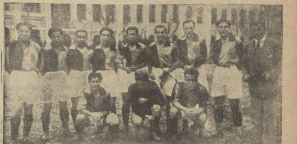
Dün Fenerbahçeyi yenen İstanbul spor takımı

İstanbul spor 4- Fenerbahçe 3 Vefa Beykoz maçında kavga çıktı