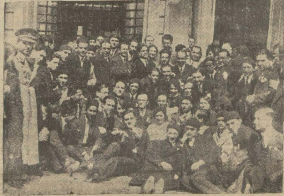
Türk ve Yunan darülfünunları talebesi bir arada..

Halk Fırkasının, eksik namzet göstereceği vilâyet meb'usları fırka tebliğinin neşri günü oldukça endişe ve telâş geçirmişlerdir. Bunlar zümre halinde meclis koridor ve lokantasında toplanarak vaziyeti münakaşa ve tahlil eylemişlerdir. Vilâyetler meyânında münhal bulunmayan vilâyetler dahi olduğuna göre hangi meb'usun açıkta kalacağı muhtelif tahminlere vesile olmuştur. Fakat şurası muhakkaktır ki Halk Fırkası riyaset divanı tekrar namzet göstereceği 230 meb'usu ve bu adede ilâve edeceği elli kadar yeni namzedini de tespit eylemiştir. Bazı vilâyetlerde eksik namzet göstermek kararını verdikten sonra Halk Fırkası, eski meb'uslardan olup yeniden namzet gösterilmesi tekrâr eden zevattan çoğunun intihap dairelerini tebdil edecektir.