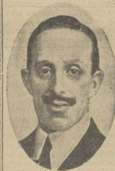
Sabık İspanya kralı Alfons

Bütün İspanya sürür içinde.. Kralın ailesi de dün sabah hareket etti. Katalonya istiklâlini ilân etti