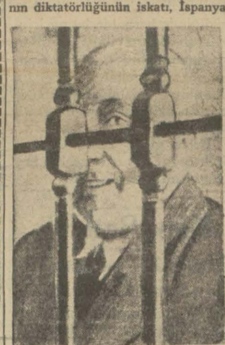
Sabık İspanya kralı Alfons

Avrupada bir taht daha devrildi. İspanya kralı on üçüncü Alfons belediye intihabatında cumhuriyetçilerin kahir bir galebe kazanması üzerine, ailesini bırakarak, İspanyadan kaçmağa mecbur kaldı. Son zamanlarda İspanyada cereyan eden hâdiseler ve müteveffa General Primo de Riveranın diktatörlüğünün iskatı, İspanya-