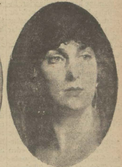
Sabık İspanya kraliçesi

Avrupada bir taht daha devrildi. İspanya kralı on üçüncü Alfons belediye intihabatında cumhuriyetçilerin kahir bir galebe kazanması üzerine, ailesini bırakarak, İspanyadan kaçmağa mecbur kaldı. Son zamanlarda İspanyada cereyan eden hâdiseler ve müteveffa General Primo de Riveranın diktatörlüğünün iskatı, İspanya-