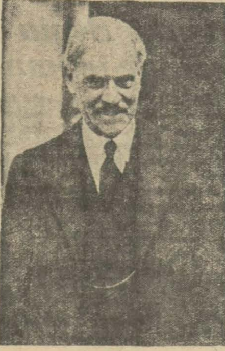
İngiliz Başvekil Mac Donald

LONDRA, 13 A.A. — Pas kalya tatillerini Lossie Mouth'ta geçirmiş olan Başvekil M. Mac Donald Avam kamarasının yarıncı içtimanda hazır bulunmak üzere Londraya avdet etmiştir. Kabinenin vaziyeti perşembe günü muhafazakârlar tarafından işsizlik hakkında verilmiş olan tevbih taktirinin rey e konulması neticesinde anlaşılacaktır. Maamafih liberallerin, nazırları dinledikten sonra hükümetin mağlubiyyete uğraması için kâfi miktarda rey vere rek ona muzaheret etmeğe karar vermeleri bekleniyor. Hükû metin mağlubiyyete uğraması kabinenin, istifası ve yeniden umumî intihabat icrası demektir