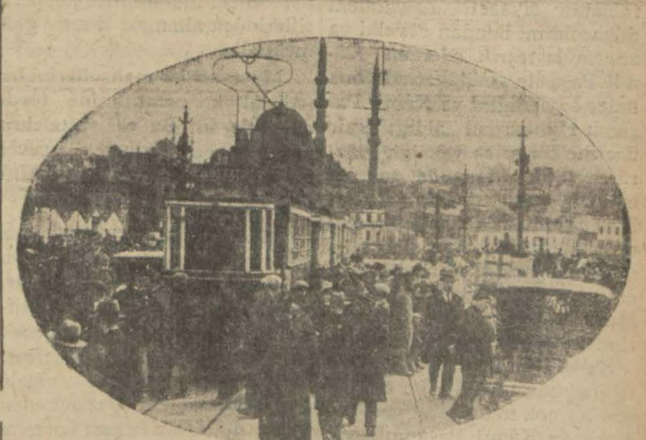
Köprü ortasında, demirli kapağa takılan tramvay arabası ve biriken halk..

Dün öğleden sonra saat 16 raddelerinde köprü üstünde bir tramvayın geçirdiği kaza neticesinde seyrişer bir saat kadar muattal kalmıştır.