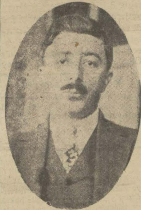
Devlet Bankasında vazife derubte edeceğinden namzet gösterilmeyeceği rivayet edilen Trabzon meb'usu Şefik Bey

Namzetler arasında beş çiftlik sahibi ile Zonguldak madenlerinde, imalat harbiyede ve fabrikalarda çalışan bazı amele de vardır. Meclis 4 mayısta fevkalâde iktimaa davet ediliyor