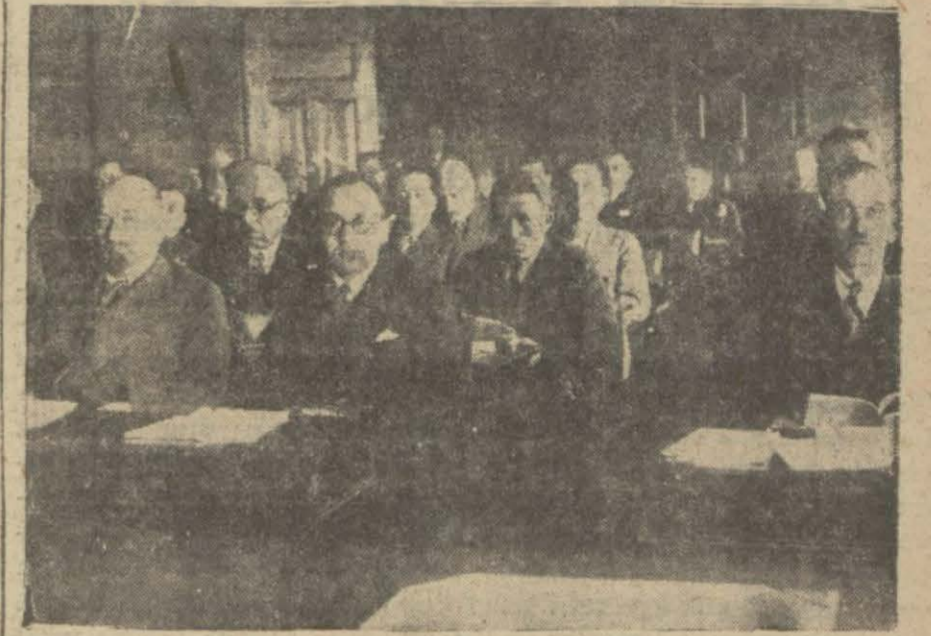
Ticaret odaları kongresinde bulunan murahhaslar