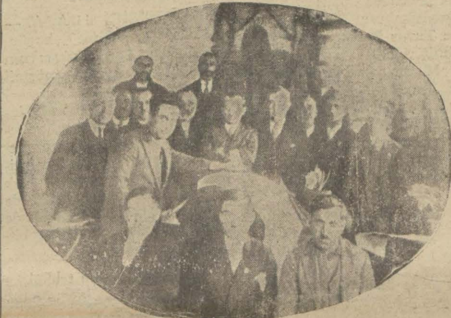
Rey sahiplerinin % 88 inin reye iştirak ettiği Şile'de rey sandığı

Bu vaziyete göre Belediye hududu dahilinde iştirak nispeti yüzde 84, mülhakat kazalarında 312,463 den 18 yaşını kırkını ederek hakkı intihabi