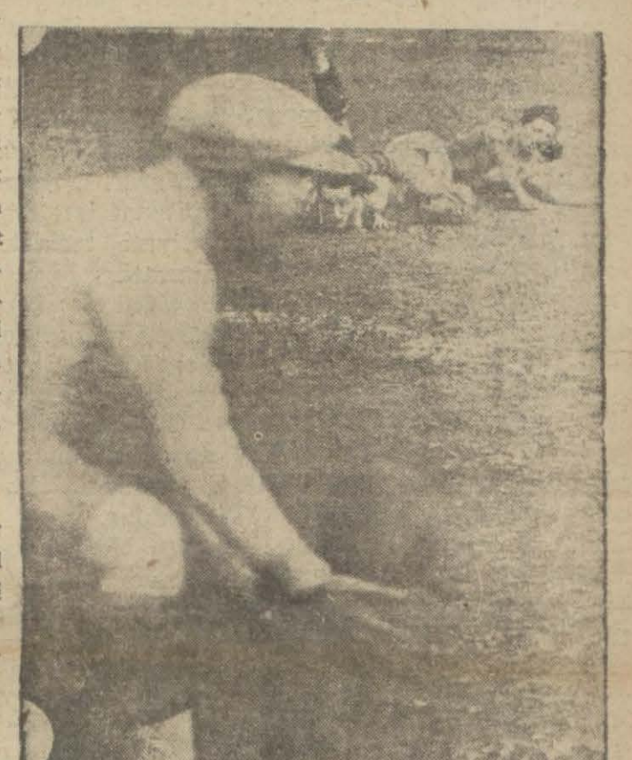
Bulgar kaleci heyecanlı bir an geçirirken

Dünyâ oyun da gösterdi: Bulgar futbolcuları, oyunculuk itibarıyla bizden yarı derece fenadılar. Yalnız kaleci-leri bizim derecemizden iyi, sol-leri bizim ayarımızda. O kadar.. Ge-