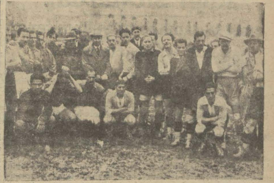
Bulgar ve Galatasaray takımları bir arada

Bu iki Bulgarın sahte pasaport kollandıkları görülmüş, bu hal şüpheli davet etmiş ve zan altına almalarını intaç etmiştir. Haklarında tahkikat yapılmaktadır.