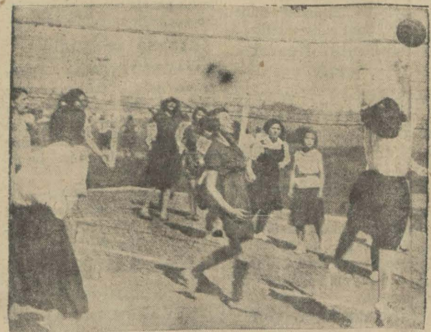
Dün Arnavutköyündeki Amerikan kız kollejinde bir çok kız mektepliler iştirakile bir spor bayramı yapıldı. Muhtelif mekteplere mensup sporcu kızların iştirak ettiği müsabakalardan birini, bir voleybol maçının hareketli bir sahmasını tesbit ediyor

ne heyeti murahhasa göndermemek suretile icabet etmemeye karar vermisi kuvvetli bir ihtimal dahilindedir.