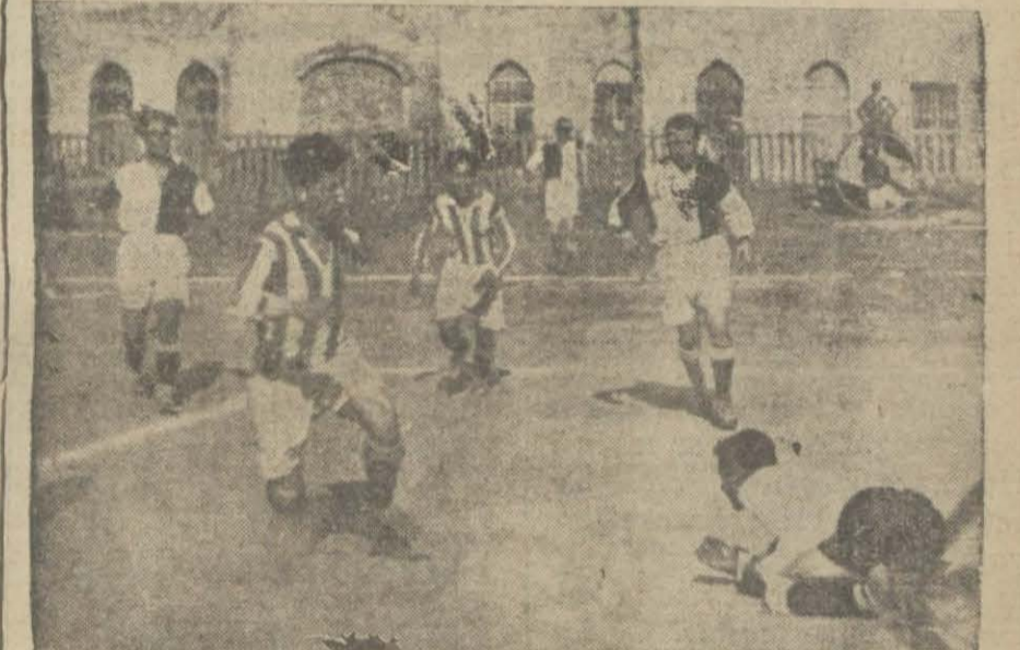
Dünkü Vefa - Süleymaniye maçından bir intiba

Buberaberlik Galatasarayın şampyonluğunu yine tehlikeye düşürdü