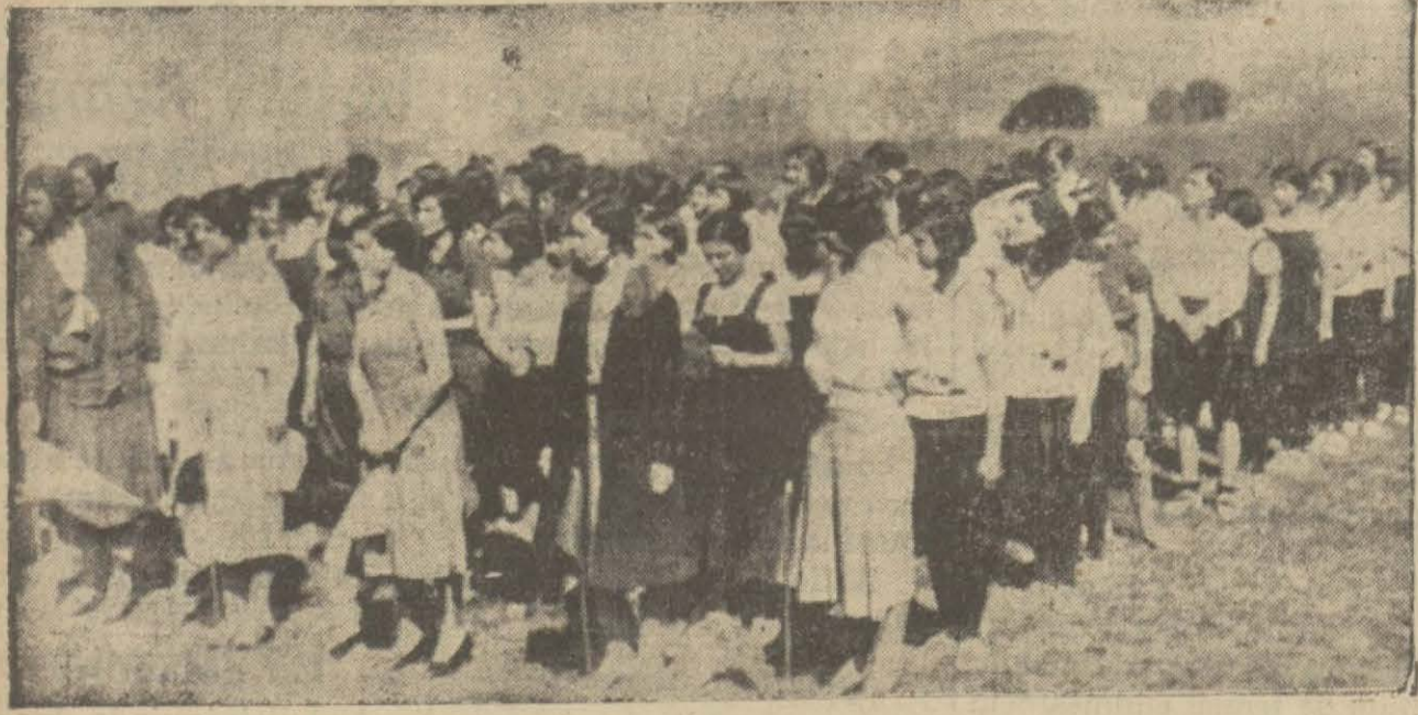
Rober kolejde dîn bir müsabaka yapıldı. Bu müsabakaya İstanbul' muhtelif kız mekteplerini davetli idiler. Resmimizde bu kız talebelerin bir kısmı görülmektedir.