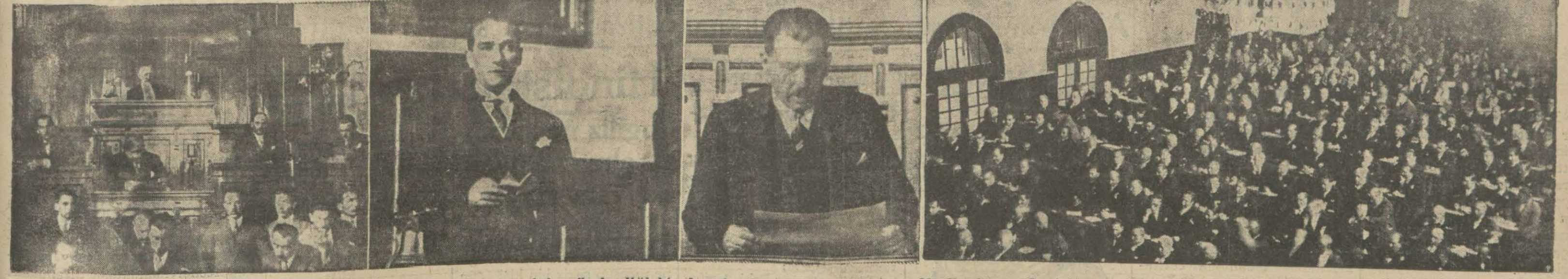
Ankara foto muhabirimizin Millet Meclisinin fevkalâde içtimaına dair gönderdiği bir kaç intiba: Soldan itibaren Meclis azası, Gazî Hz. ve Kâzım Pş. tahlif edilirlerken, Meclis hali içtimada iken