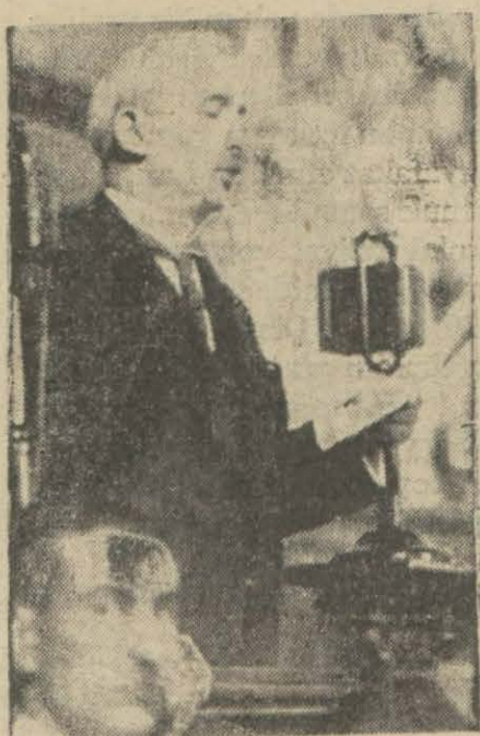
Başvekil Meclis huzurunda yemin ederken

Halk fırkası idare heyeti yarın sabah içtima ederek meclis encümenlerine dahil olacak azalar hakkında müzakerede bulunacaklar ve tesbit edilecek listeler fırka meb'uslarına tavsiye edilecektir.