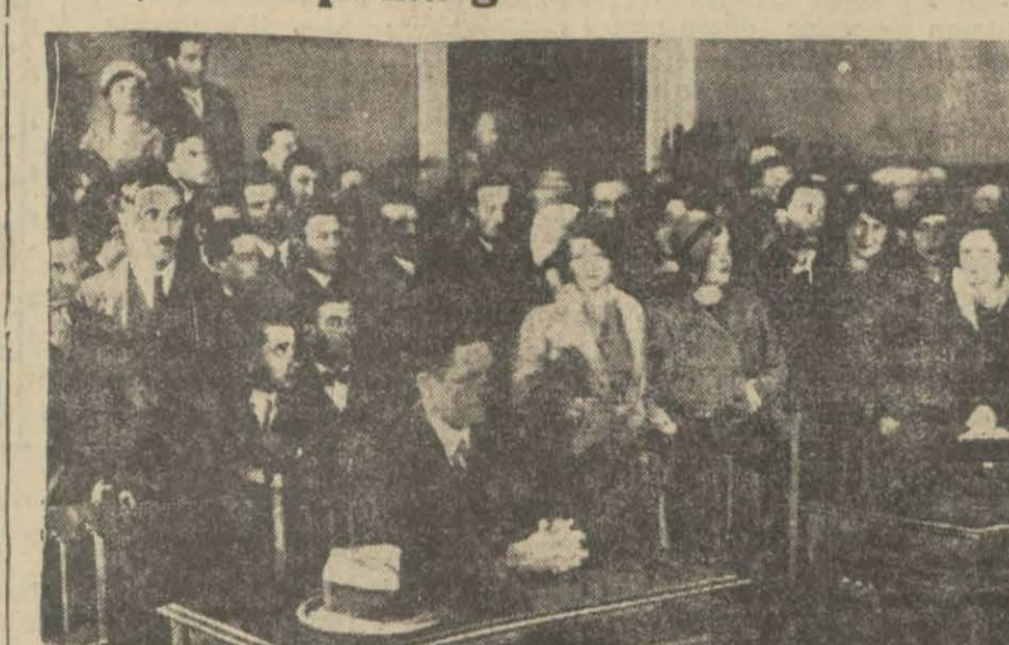
Komünist şairi Nâzım Hikmet B. ceza mahkemesinde

Şair Nazım Hikmet Beyin şimdiye kadar neşrettiği şiir mecmuaları komünist propagandası mahiyetinde görülerek mahkemeye verilmişti.