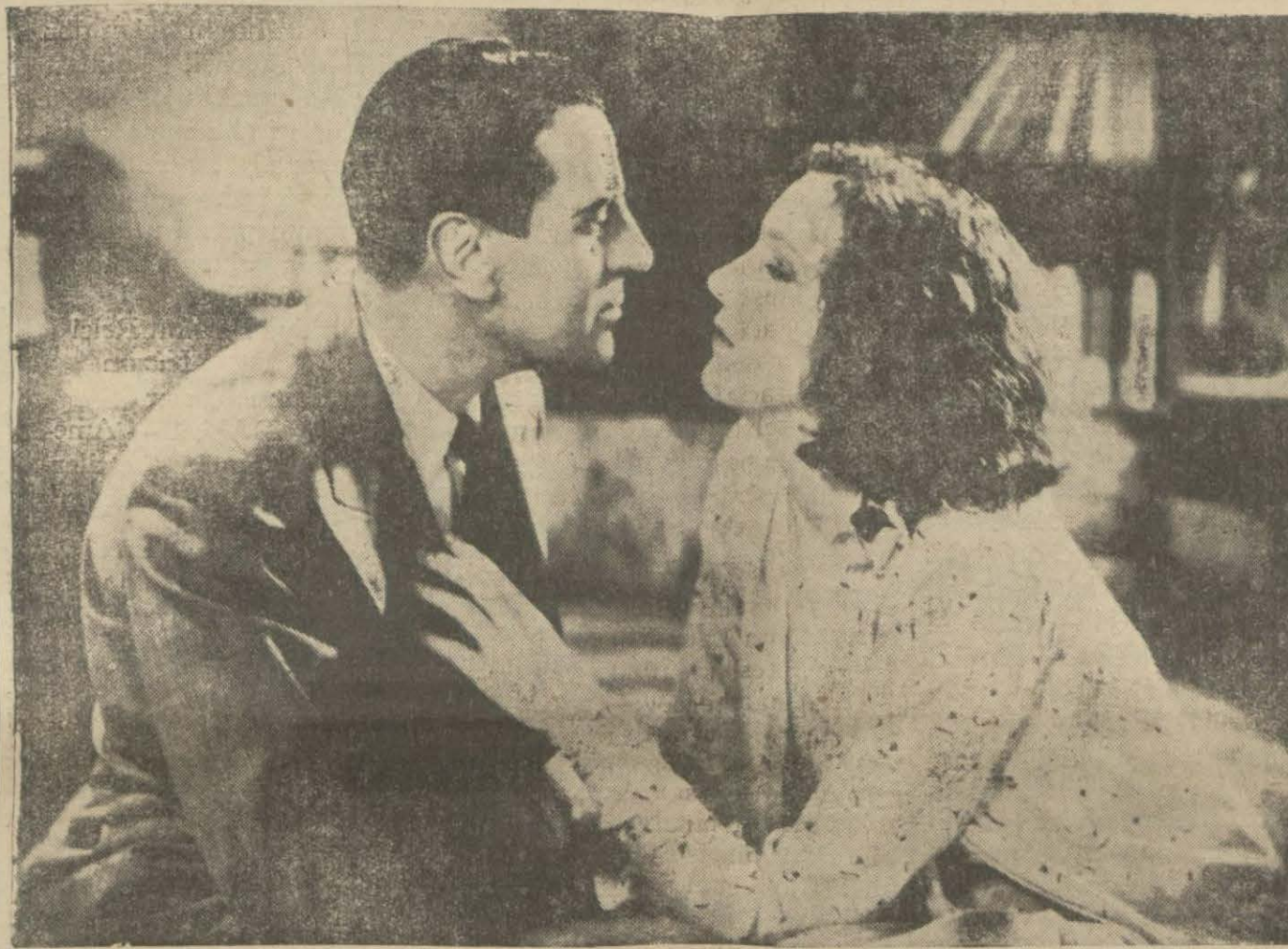
(Foks Revü) den bir sahne

Majik sineması perşembadanberi: Esrarengiz artist "Grata Garbo",nun almanca çevirdiği Anna Kristi ismindeki filmi geçiyor. Grata Garbo hakkında söz söylemeyi za it buluyoruz. Anna Kristi mu-