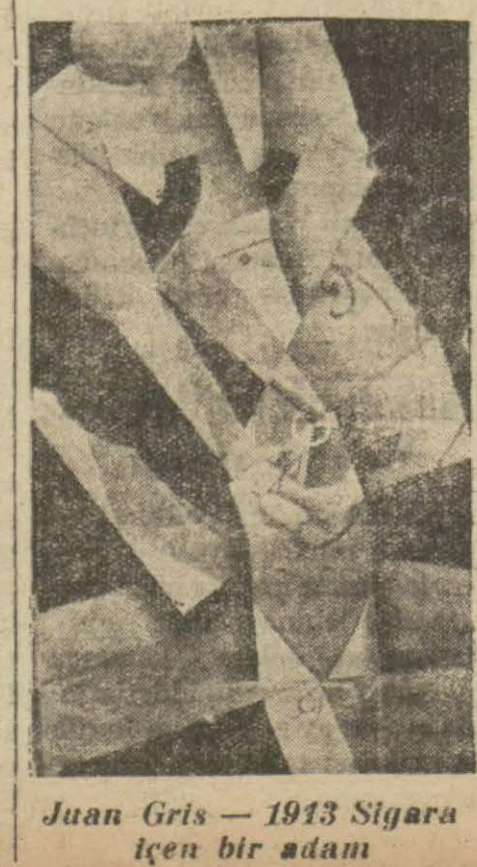
Juan Gris — 1913 Sigara içen bir adam

değildir. Geçenlerde genç bir ressam henüz ihtiyar olmıyan