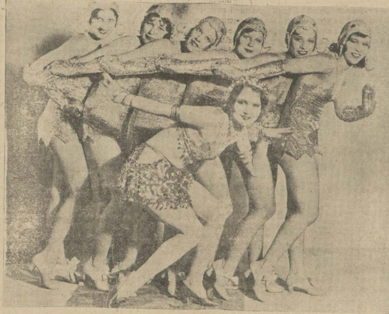
(Çılgın macera) dan bir sahne

vaffak olmuş bir filmidir. Bütün kritikler bu filmden alâka ile bahsetmişlerdir. Mevzu şu dur: