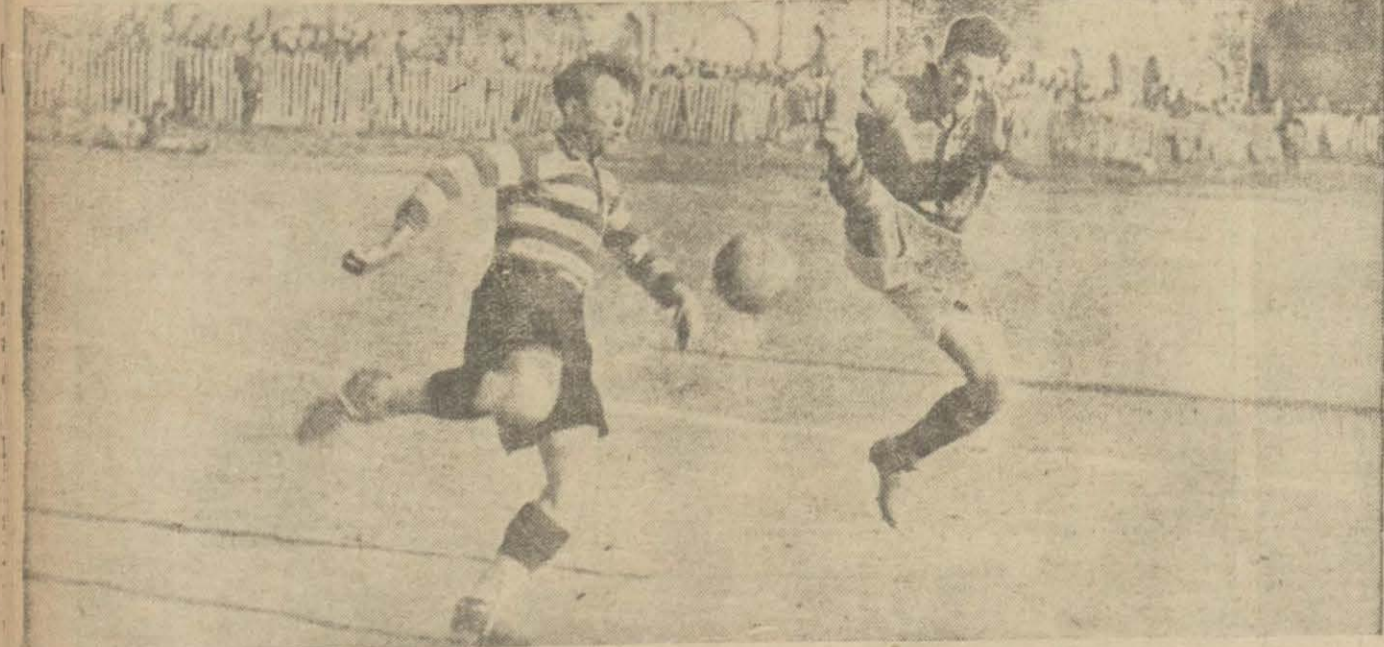
Galatasaray-Beogradski maçından heyecanlı bir sahne

Maçlar hararetlidir. Takımlarımız güzel oynadılar