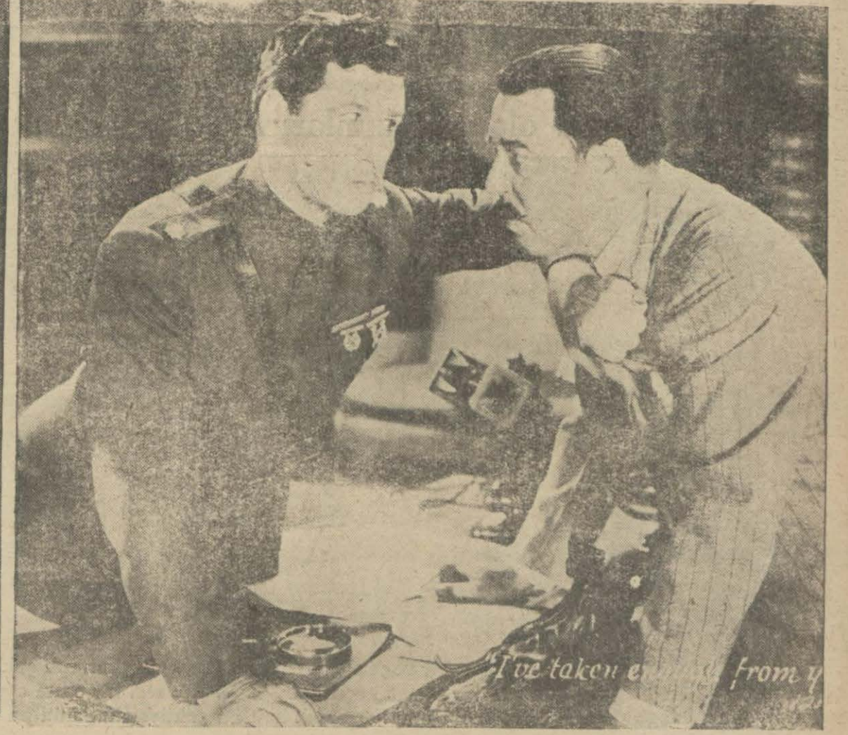
(Yılmaz) filminden bir sahne