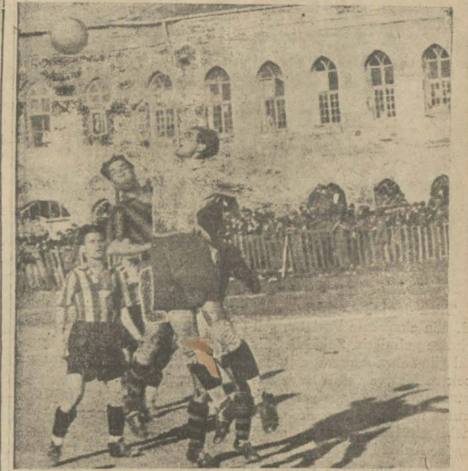
Dünkü maçın bir itiba

Moskova sefiri Hüseyin Rağıp Beyin değiştirileceği veya hut met'us olacağı ve yerine eski fırka kâtibi umumisi Saffet Beyin tayin edileceği hakkındaki rivayet teyiyüt etmemiştir. Hüseyin Rağıp Bey: Moskova sefaretinde kalacaktır. Münhal olarak yalnız Varşova sefaretimiz kalıyor. Son günlerde Varşovaya Vasıf Beyin sefir olarak gönderileceği hakkında bir rivayet çıktı. Hat tâ bir kaç ay sonra bu sefarete Fethi Beyin gönderileceği bile söylendi. Fakat henüz Varşova sefaretimiz için tekarür etmiş bir şey yoktur.