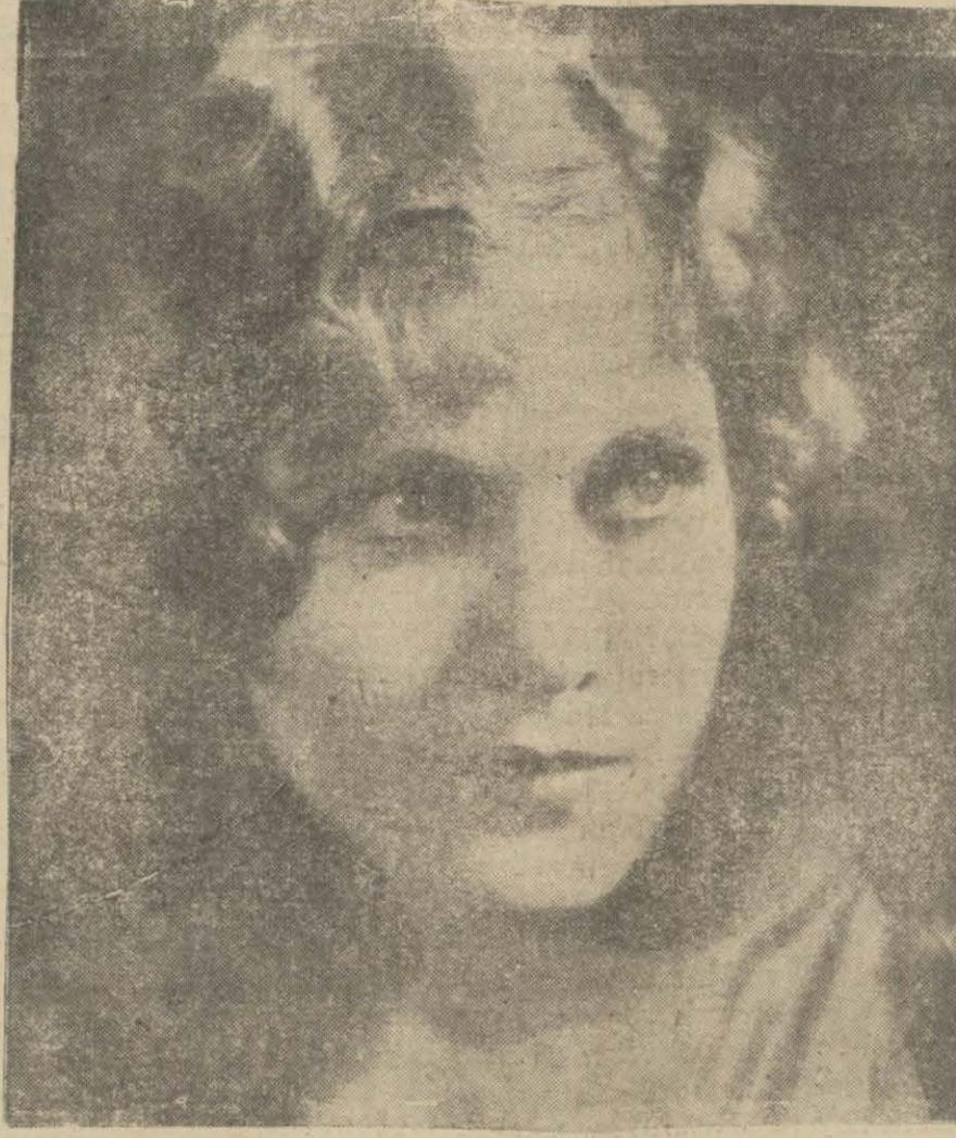
(Yılmaz) filminde oynayan Ester Ralston