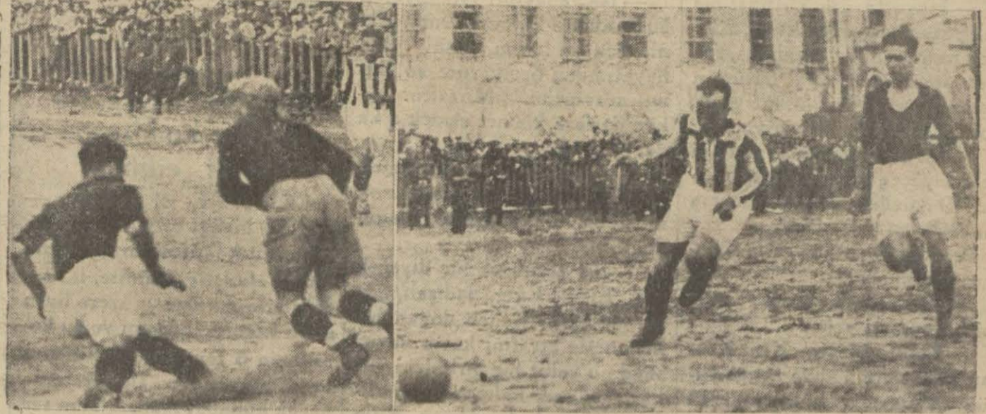
Dünkü maçı iki enstantane