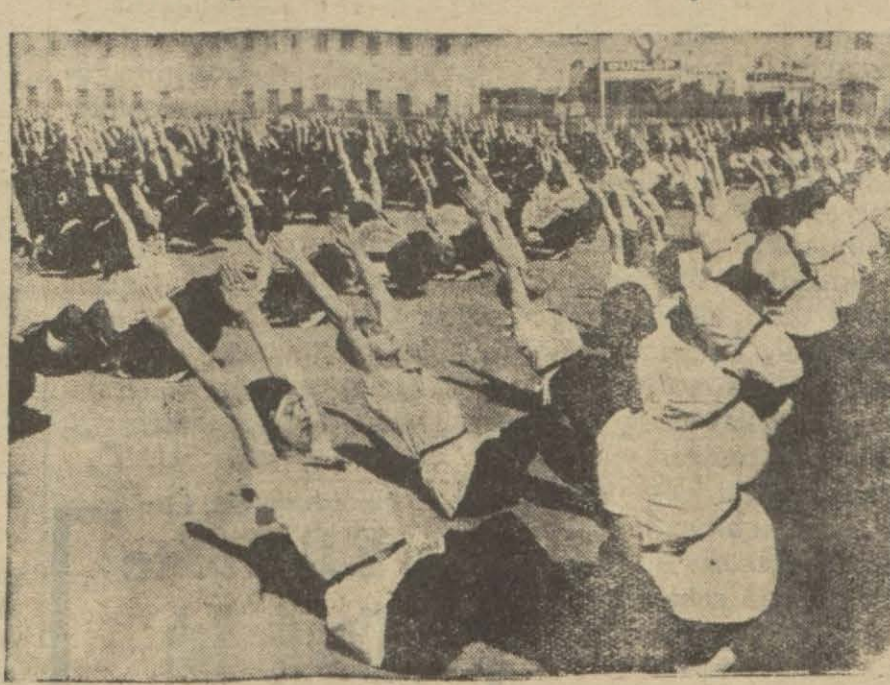
Dünkü talimlerden bir intiba

Aynı on beşinde Taksim stadyomunda yapılacak olan mekteplilerin idman bayramının dün bir provası yapılmıştır. İdman bayramlarına iştirak edecek bütün mektepler öğleden sonra kısmen tamvayla ve kısmen ya olarak Taksim stadyomunda toplanmış ve idman bayramında akakları mahalleri işgal ve bazı idman hareketleri yapmışlardır.