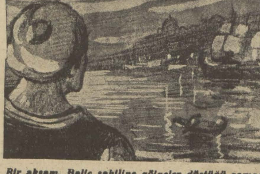
Bir akşam, Ballı sahiline gölgeler düştüğü zaman [Yeni tefrikamızı ikinci sahifede okuyunuz]