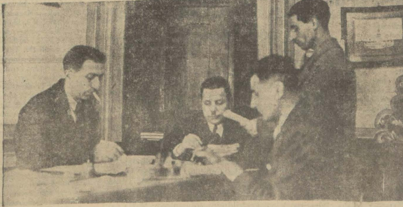
Muhtarlar her mahallede hararetili bir faaliyete gösteriyor ve defterleri dolduruyorlar