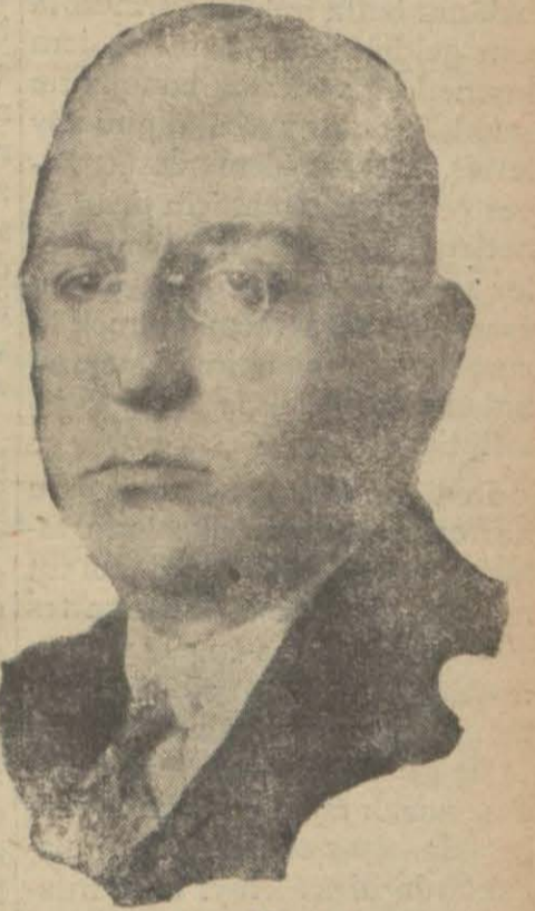
Tevfik Kâmil Bey

Komisyon heyeti umumiyesi bugün toplanacaktır.