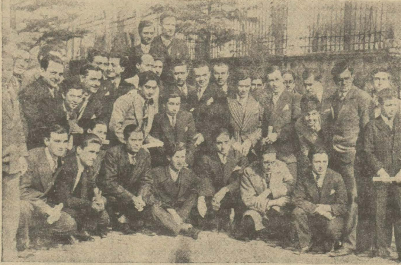
İstanbul lisesi mezunları bir cemiyet teşkil etmek için bir kongre aktettiler. Resmimiz, kongreye iştirak eden zevattan bir kısmını göstermektedir.

tanelerini kullanınız. Büyük eczanelerde ve ecza depolarında bulunur. C. Fröhlich, Sultan Hamamı-Kenarıs Han 6 İstanbul