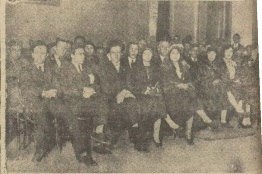
Beyoğlu Halk Fırkasında gençler mahfili tarafından verilen konseri dinleyen hazurdan bir grup

4 - İzahat almak isteyenler umumî müdürlük Fen hey'eti reisliğine müracaat edebilirler.