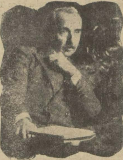
İsmet Pş. teddi intihap müzakeresini Mecliste dinliyor

Daimî encümen bu gün toplanarak heyeti teftişîye vazifesini görecektir, intihap programını yapacaktır