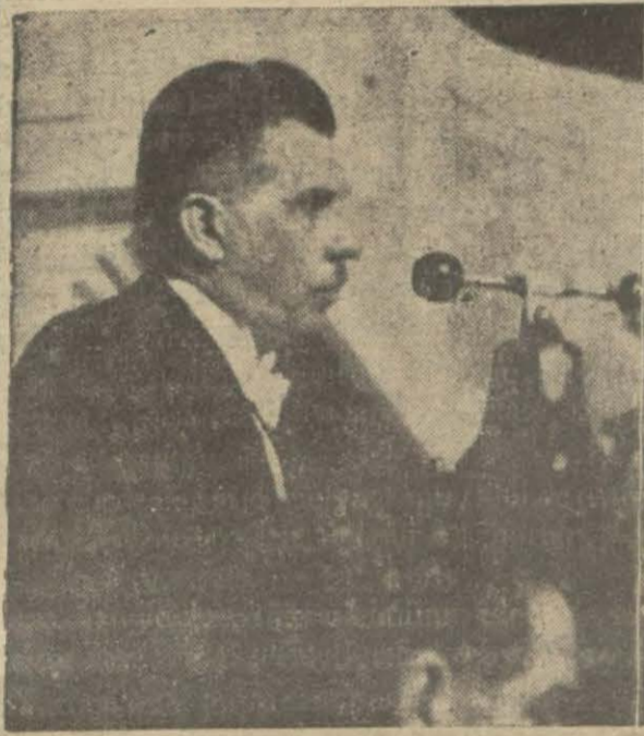
Solda Kâzım Pş. Meclise riyaset ederken, sağda Millet Meclisinin tariht içtimaidan bir intihap.

Rapor Heyeti vekilece kabul edilirse gayri müba diller zürri evkafı üzerinde haklarındaki istifa edilebileceklerdir.