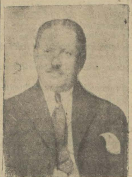
İzmir valisi Kâzım Pş.

ANKARA, 6 (Telefonla) — Müfettişî umumîlikler, intihab müteakip yeni Meclisin, faaliyete geçmesi ve ıslahat pro-