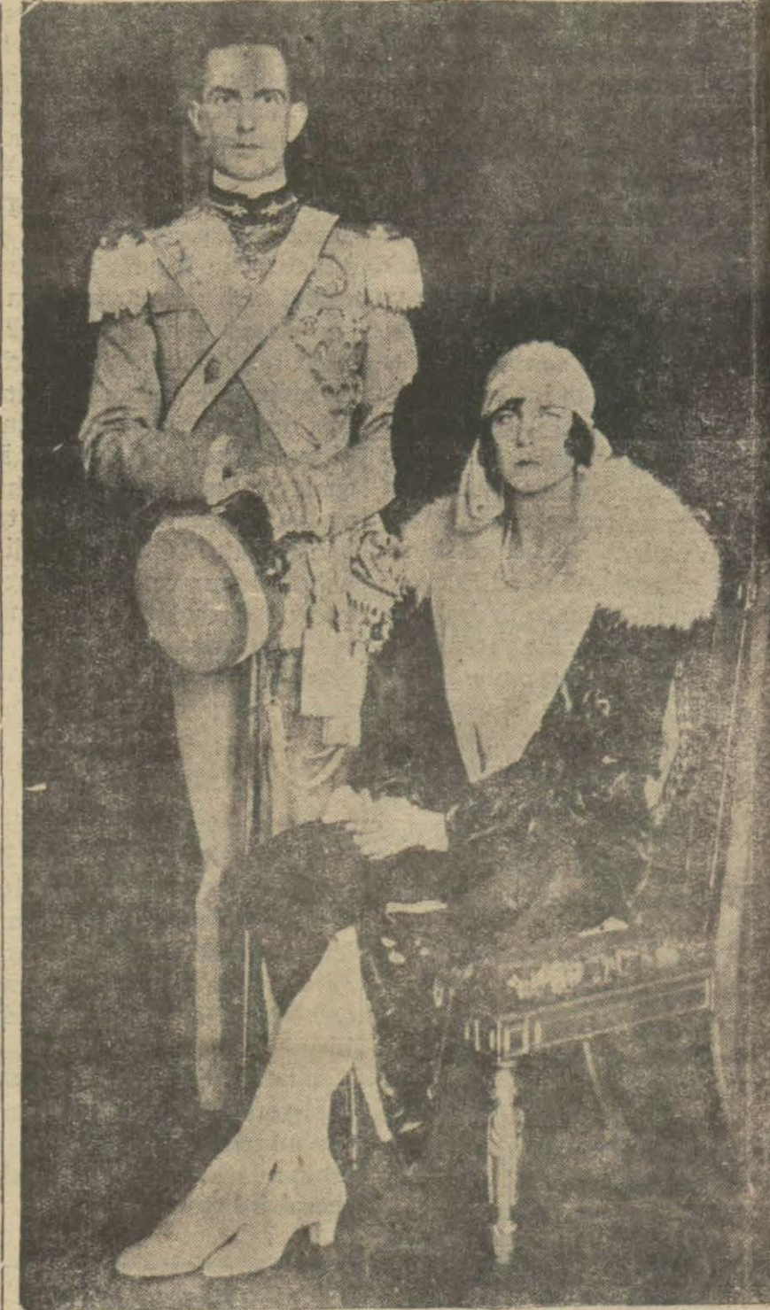
Geçen sene Romada parlak merasimle düğünleri icra edilen İtalya vefiahtı Prens Umberto ile zevcesi Belçika kralının kızı prenses Joze arasında son zamanlarda geçimsizlik olduğu rivayetleri devran etmektedir. Bunların aslı olmadığı kat'i surette bildirilmemiş olduğu için bundan sonra artık bu kabil dedikoduların nihayete bulacağı zannedilir. Buna ait tafsilât ikinci sahifededir.