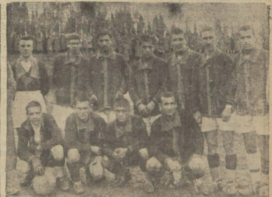
Fey canlı bir maçtan sonra Kuleli ile berabere kalan Halıcıoğlu takımı

İzmirde rejim ve memleket lehine büyük eserler vücade getirdiğinden takdire lâyık görülen vali Kâzım Paşanın müfettişî umumîliklerden birine terfian tayini muhkakk gibidir. Bundan başka muhtelif valiliklerde şimdilik bir tebeddül mev-