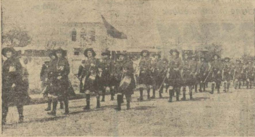
Adanada kızlarımız izcilige büyük bir ragbet göstermektedirler. Bu suretle yeni neslin kızları dahi sporcu olarak yetişmektedirler. Resmimiz, Adana kız muallim mektebi izcilerini hareket halinde gösteriyor.