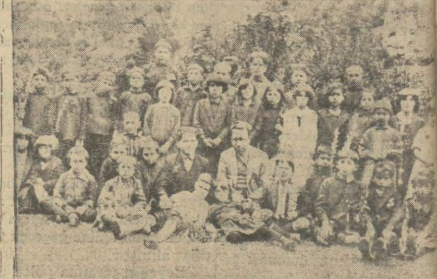
Borçsada ilk mektep talebeleri muallimleriyle birlikte