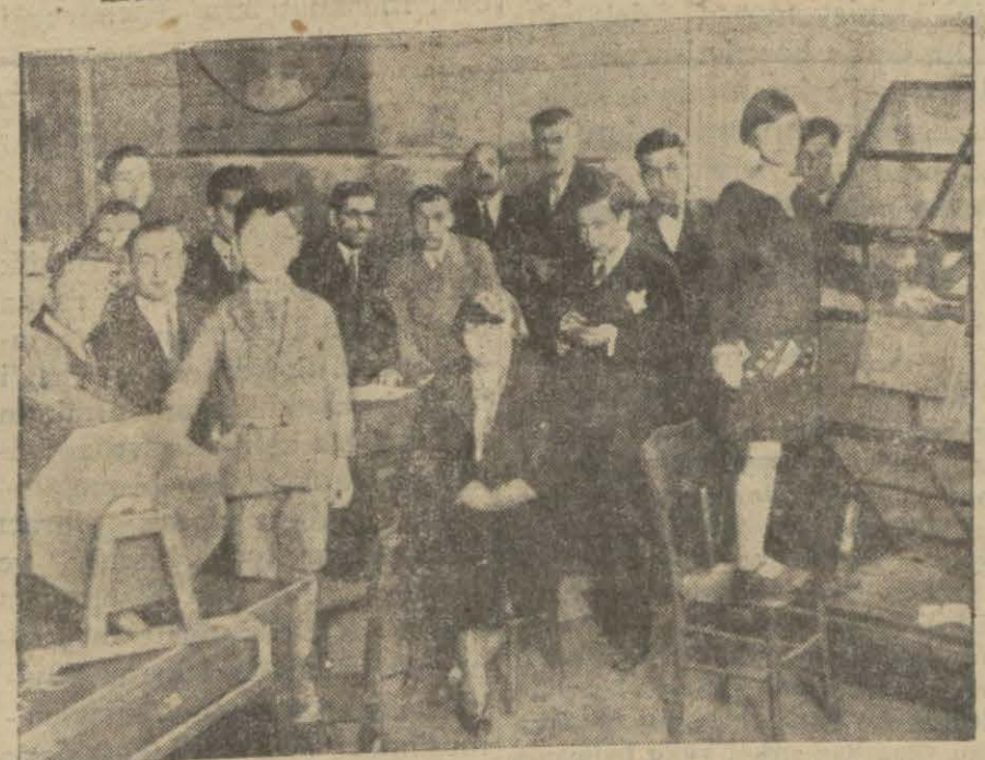
Türk Maarif cemiyeti piyangosu çekilirken..

Henüz bu yaşa gelmeyenleri aza namzedi telâkki etmek ve onları buna göre hazırlamak lazımdır. Fırkamızın yüksek mefkûresini ve programının esaslarını bütün vatandaşlara anlatmalıdır.. Reiscümhur Hazretleri, bir milli muallim heyeti, milli inkılâp heyeti addettikleri Cümhuriyet Halk fırkası mensuplarına daima daha ziyade ve daha müteyakkız çalışmalarını tavsiye buyurmuşlardır. Bundan sonra Türkocağını ziyaret etmişlerdir. Ocağın işgal sahaları, azamın âlaka ve faaliyeti hakkında izahat almışlar, ayrılırken: "Konyanın kıymetli ve güzide gençleriyle karşı karşıya bulunduğumdan ve kendilerini her vakit olduğu gibi şen ve şatır bulduğumdan çok memnun ve müteşekkirim..", demişlerdir.. Fırkada ve ocaкта azalar büyük ziyaretcisi hüremle alkışlamışlardır.