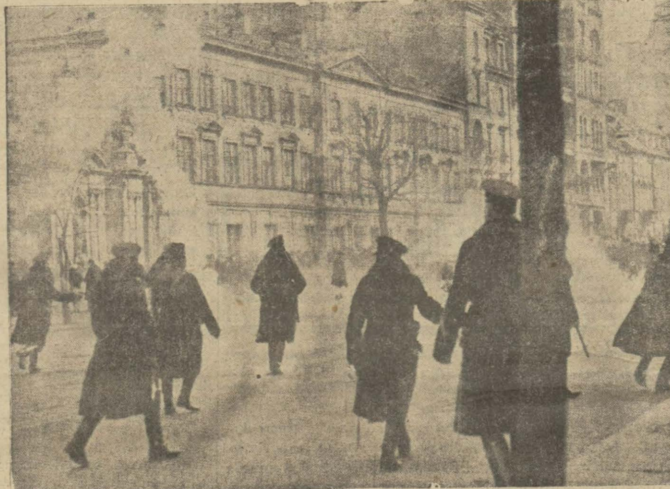
Avrupada sokak nümayişlerini dağıtmak için zabıta yeni bir vasıtaya müracaat etmektedir. Bu da eczalı bir takım bombalar atarak bunlardan çıkan gazla nümayişçilerin gözlerini yaşartmaktadır. Bu resim, Varşovada geçenlerde yapılan bir nümayişte atılan bu kabli bombaları göstermektedir.