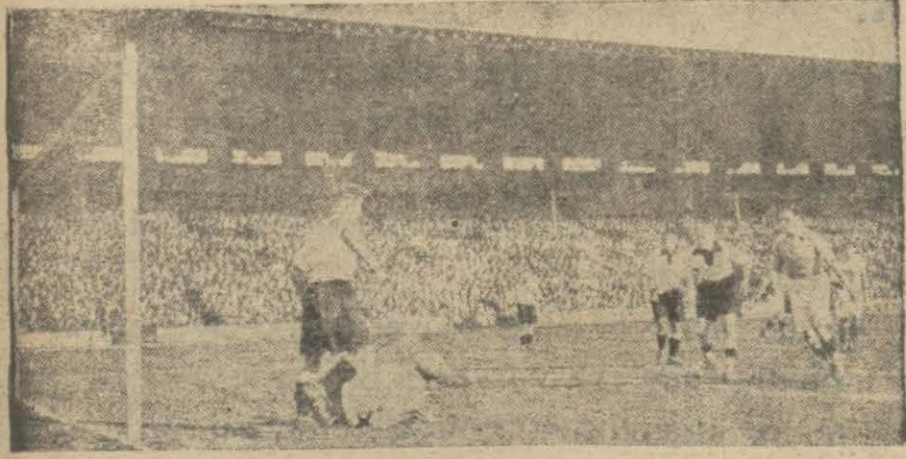
Geçenlerde Fransada, Alman futbolcuları ile Fransız oyuncular arasında mühim bir maç yapıldığı malumdur. Resmimiz, bu maçta pek heyecanlı bir sahneyi göstermektedir.