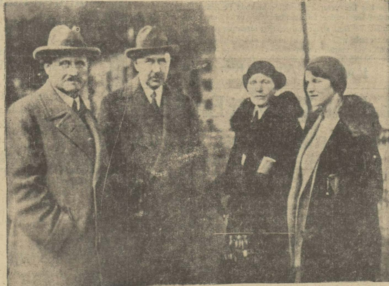
Istanbulda mezunen bulunan Almanyanın İsviçre sefiri dün ekspresle mahalli memuriyetine hareket etti...