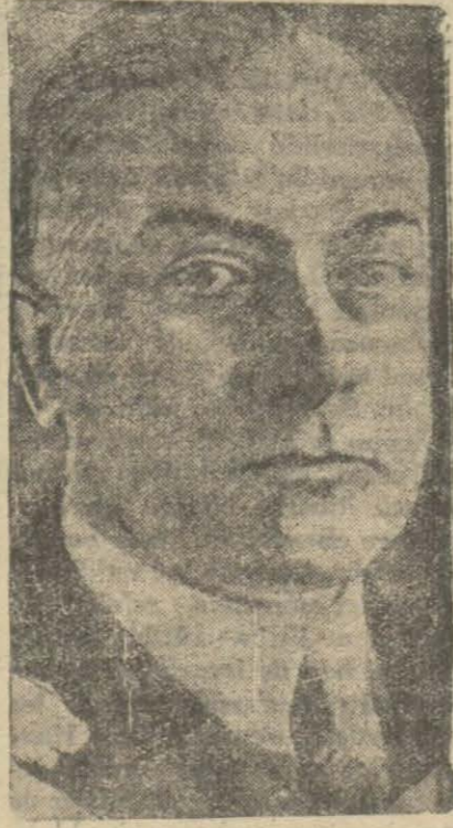
Alman hariciye nazırı M. Curtius

Gümrük Birliğe diger devletler de girebilecek