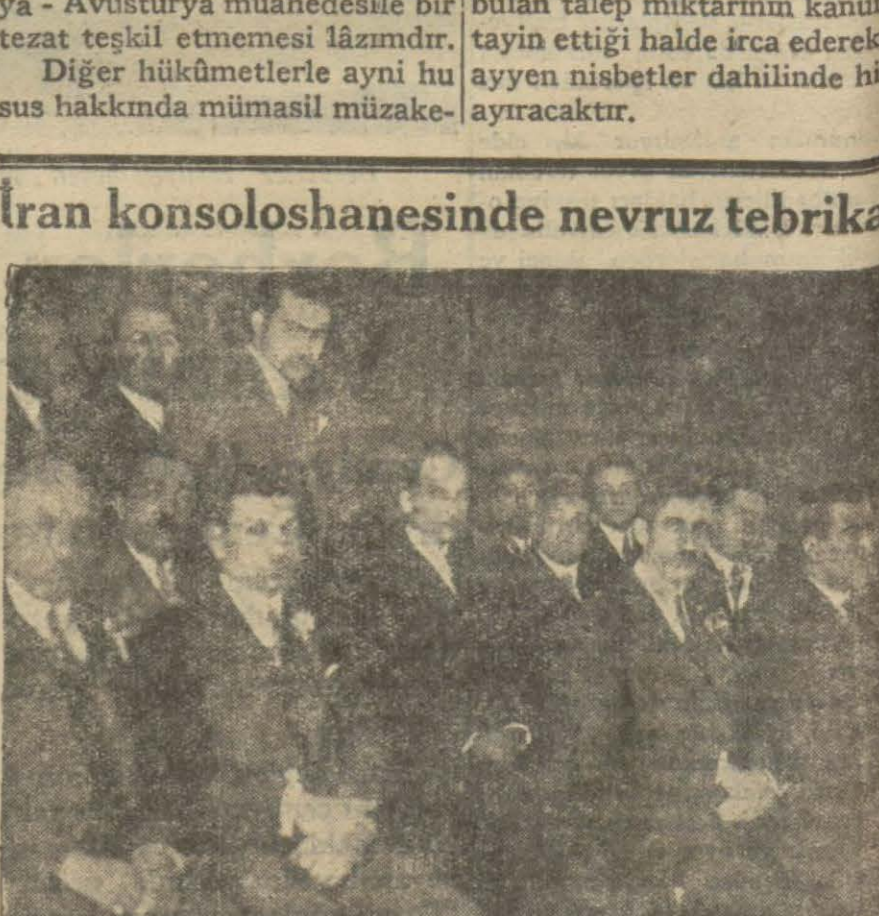
İran konsoloshanesindeki resmi kabulde bulunan İranlılar

Dün İranlıların nevrüzu idi. Bu münasebetle İran konsoloshanesinde bir resmi kabul yapılmıştır. Sefir namına konsolos Esedullah Han tebrikatı kabul etmiştir. İran tüccarlarından bir zat nutuk söylemiş ve konsolos tarafından Türki ve İran istiklâl marşları çalınmıştır. Hazır bulunan zevata nevrüziye ikram edilmiştir. Dün nevrüz münasebetile şehrimizdeki ekseri İranlılar