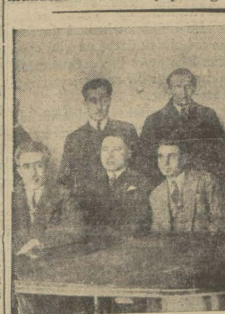
Berberler cemiyeti heyeti idaresi dün hali içtimada iken

Hey'eti teftişyeye dün de yepiden 65 vatandaşı müracaat ederek itiraz haklarını istimal etmişlerdir. Şimdiye kadar itiraz edenlerin adedi 130 u bulunmaktadır. Hey'eti teftişye intihap edilecek meb'usların miktarını bugün ilân edilecektir. Keyfiyet de ayrıca dahiliye vekâletine bildirilmiştir. Dün akşam fırka bütün kaza ve nahiyelerine bir tebliğ göndererek şehrimizden kaç meb'us ve münthehibi sani çıkacağını bildirmiştir. Kat'î adet taayyün ettiği cihetle 1559 münthehibi saninin mlntakaları tesbit edilmiştir. Ancak namzetlere bu ayın son günü, yani intihaptan bir gün evvel vaziyet bildirilecektir.