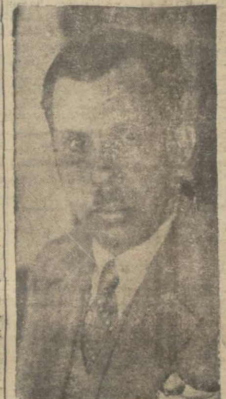
Meclis Reisi Kâzım Paşa

ni celsede B. M. M. Reisi Kâzım Paşa bir nutuk söyleyecektir.