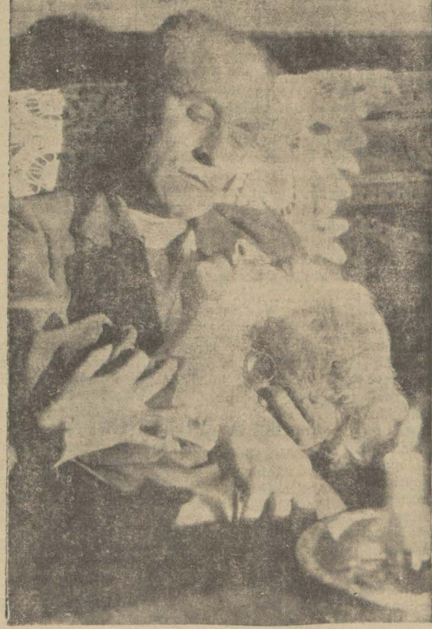
"Müddet umut Hatters" filminden