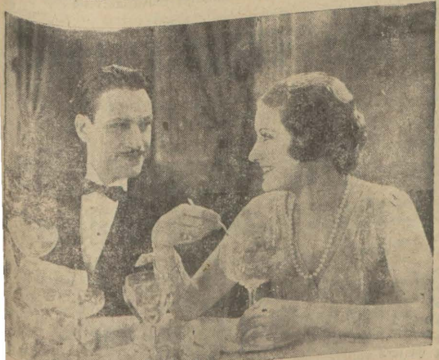
"İttiham ediyorum" filminden