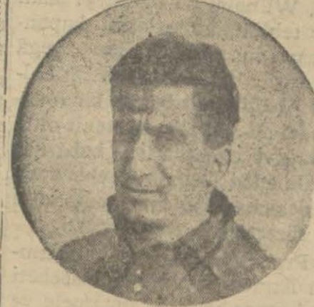
Galatasaray kaptanı Nikat B.

Galatasaray - Fener maçı iki takımın kıymeti hakkında bir miyar olacak