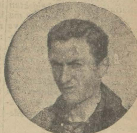
Fener kaptanı Zeki B.

Geçen hafta Fenerin Vefa karşısında uğradığı mağlûbiyeti görenler, bugün behemehal G. Sarayın galibiyetini bekliyorlar.