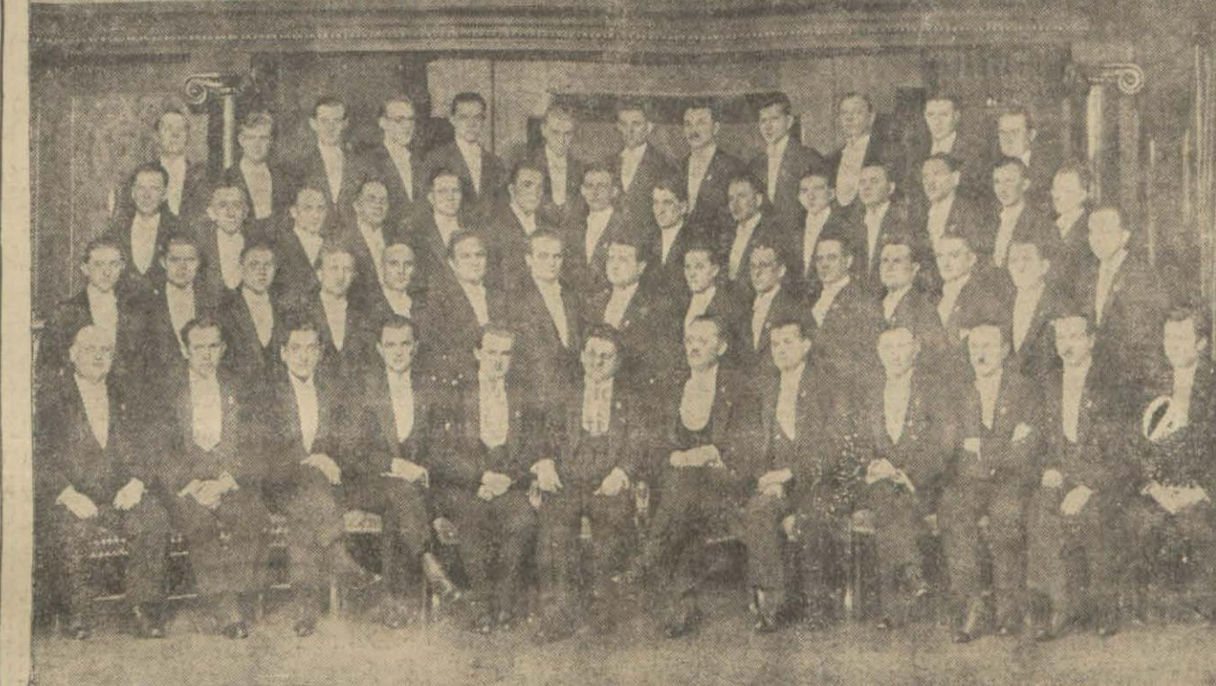
Çek koro heyeti

Filmin mevzuunu burada tamamile hikâye etmek belki kâriyelerimizin onu görürken alacakları zevki ihlâl edebilir mülahazasında olduğumuz için yalnız bunun garip bir adlı vak'a olduğunu söylemekle iktifa edeceğiz. Eser kuvvetlidir.