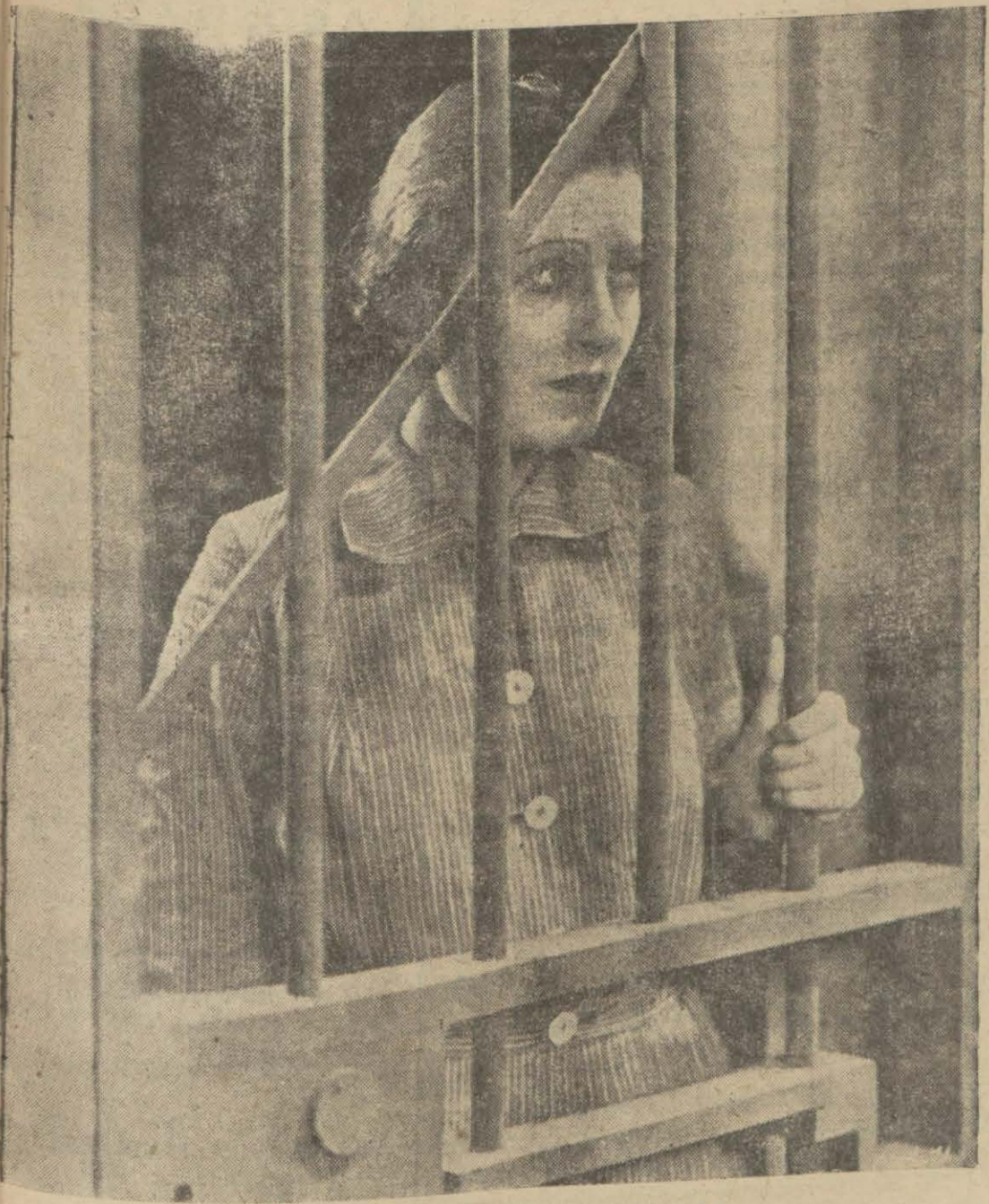
"İttiham ediyorum" filminden