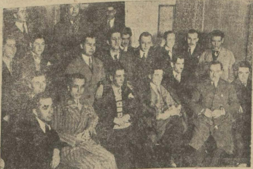
Tıp talobe cemiyetinin geçenki içtimandan bir intiba

Gürültü aيدات yüzünden çıktı polis müdahale ederek içtimai dağıttı