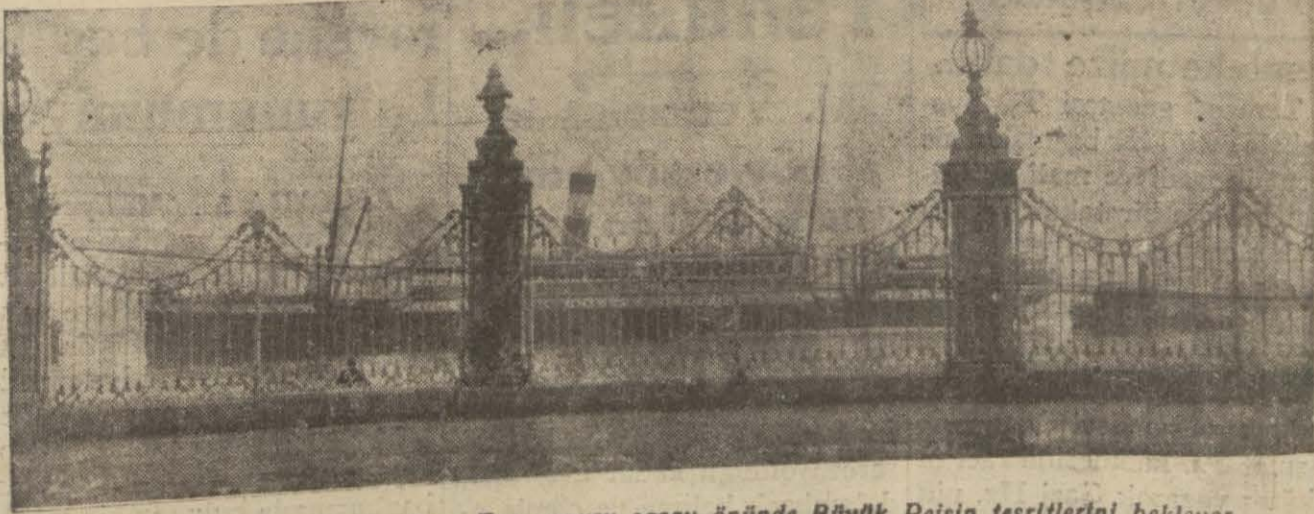
Gazi Hz.ni Mudanyaya götüren Ege vapuru saray önünde Büyük Reis'in teşriflerini bekliyor