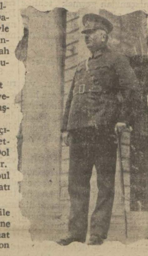
Divanı harp mıntakası kumandanı Fahreddin Paşa Dolmabahçeden ayrılmıştı.

Gazi Hz. Şükrü Kaya B. ile Fahreddin paşayı öğle yemeğine alkoymuşlar ve kendilerile saat onda başlayan mülakatlar on altıya kadar devam etmiştir. Şükrü Kaya B. altı saat sü-