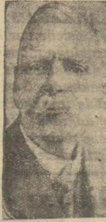
Mareşal Joffre (En son bir resmi)

[Umumî haberi] bin 914 de başlangıcından itibaren 916 senesi sonuna kadar Fransız başkumandanı olan Mareşal Joffre 78 yaşındaydı. Değerli bir asker, kurtuluş harbinin nazik zamanında memleketine hizmet etmiştir.