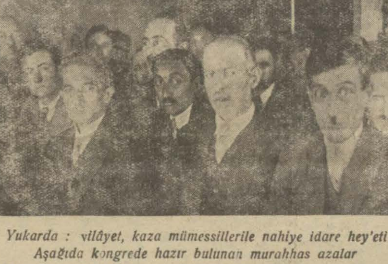
Yukarda : vilâyet, kaza mümessillerile nahiye idare heyeti. Aşağıda kongrede hazır bulunan murahhas azalar