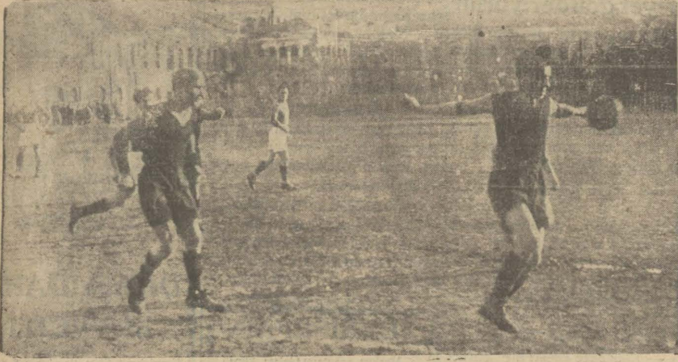
Dünkü maçtan bir intiba