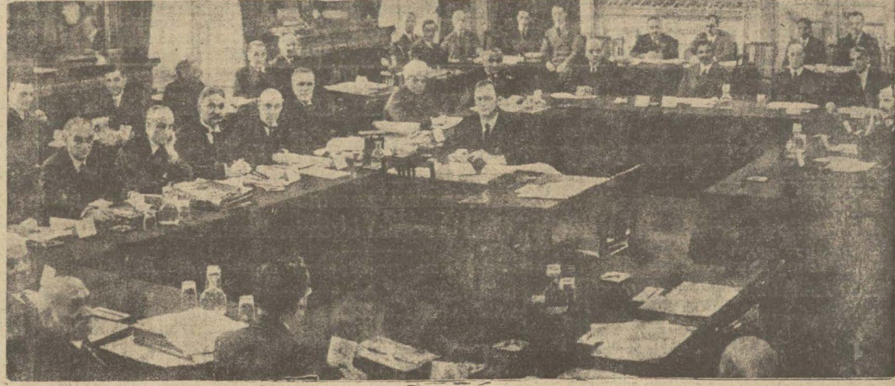
Londrada toplanan Hindistan konferansı Hindistan için yeni bir idare usulü tesbit etmiştir. Fakat bütün kararlar, İngiliz parlamentosu ait olduğu için bunun ehemmiyeti ikinci derecededir. Konferansın içtima halinde alınan bir resmini İngiliz gazetelerinden iktibas ed konferans artık dağılmış. Murahhaslar memleketlerine hareket etmişlerdir.

Ramazan Ayına Mahsus Galatada Karaköyde börekçi fırını ittisalinde büyük mahallebicinginin üstünde