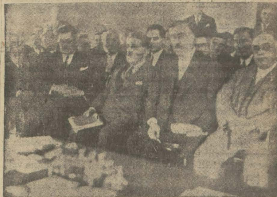
Halk Fırkası Vilâyet kongresi içtima halinde

Esnaf cemiyetleriyle mühim şekilde meşgul olunacak ve tahkikat bir haftada bitirilecektir