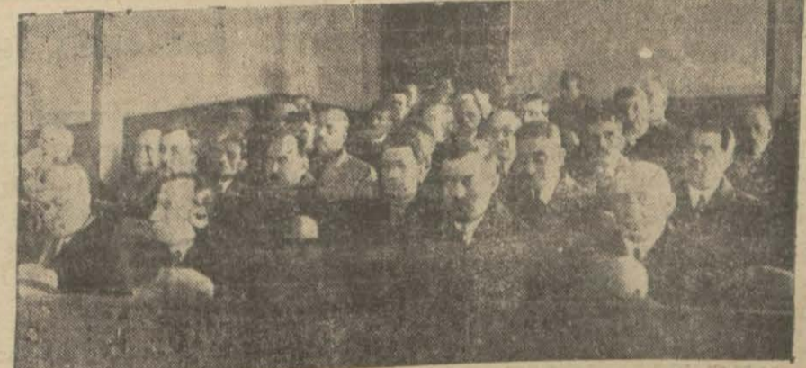
Etibba odası kongresinde bulunan zevattan bir grup

Her sözü geçenin, her eli her (Devamı 5 inci sahifede)