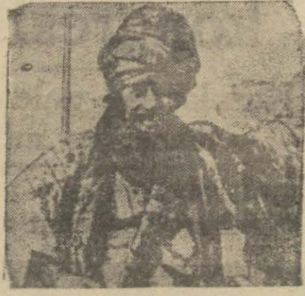
Bir Kürt şakası

Şeyh Saidin oğlu Selâhaddin Bağdatta tahsil ettirip Türkiyeye gönderenler hesaplarında aldandılar. Selâhaddin verdiğini kendisinin Türk olduğunu, hiç bir zaman kendi arkadaşlarına fenalık yapmayacağını ve bu işde kendisinin deriz, kendisini sevk edenlerin aldandığını söylemiştir.