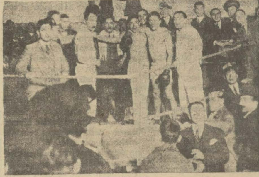
Kaşık Kemal - Angelides maçından bir enstantane

Hususi idarelerin bankaya tevdi edeceği mebalîğ bareme tabi tutulacak olan muallimlerin baremde muallim maaşlarına göre tanzim edilmiş olacaktır.