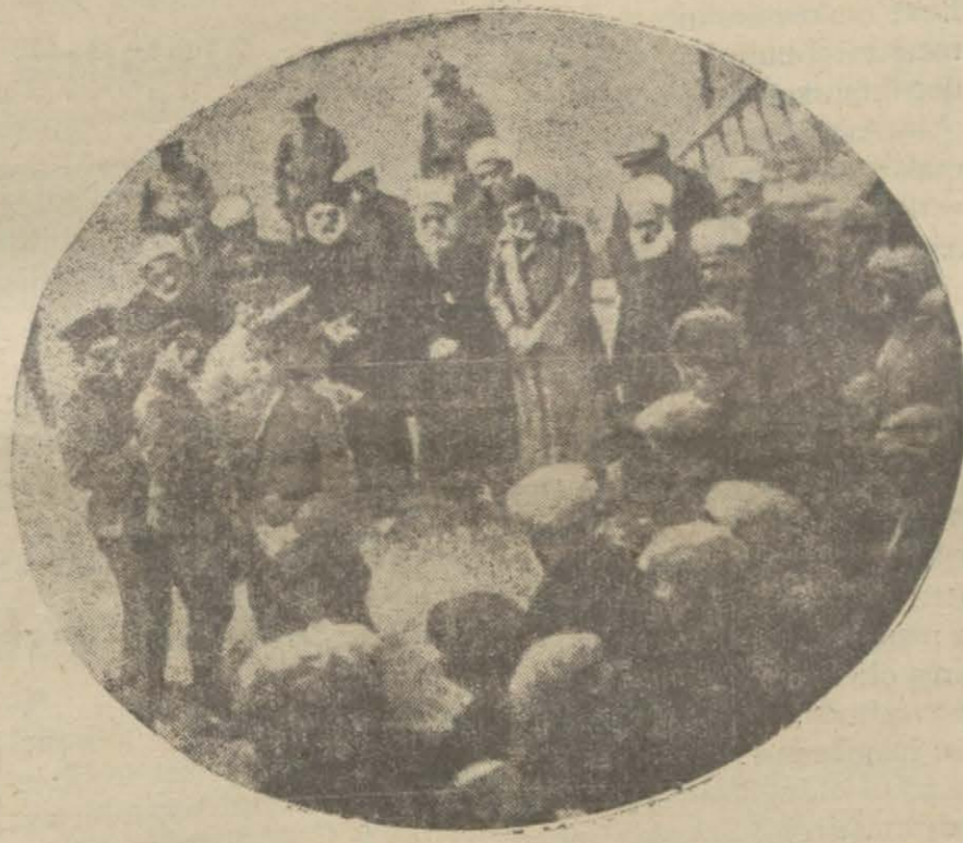
Mevkuf hocalar yoklama ediliyorlar

Hey'eti hâkime bugün de maznunların ifadelerini tetkik ve vereceği kararı hazırlamağa devam edecektir