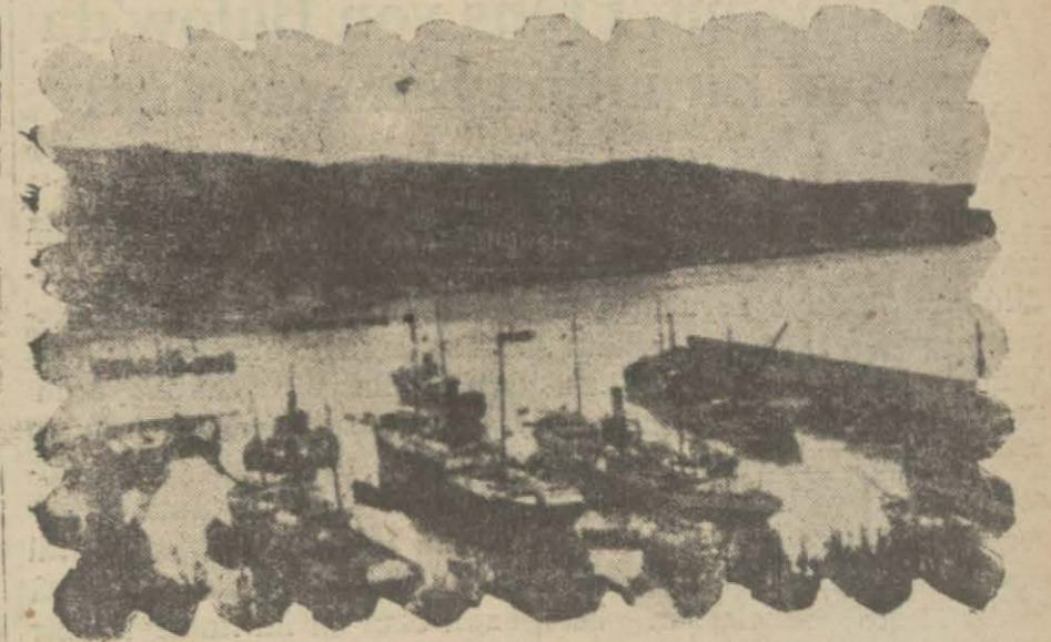
Son emre kadar seddedilen Zonguldak limanı

Ankara, 21 ( Telefonla ) — A... lınan malûmata nazaran Fran... sız ceneralı "Franchet D, Espe... rey..", i hudutta "Dirzor..", dan ge... çerken çerkes Etemle gizli bir... mülâkatta bulunmuştur. Diğer... tarafından haber aldım ki, Yun... nistandan çıkarılan yüz ellilik... lerin Suriyeye girmelerine... Suriye hükûmeti müsaade... etmemiştir. Buna mukabil... Şarkî Erden hükûmeti bunlara... hüsnü kabul göstermiştir. Şar... ki Erden hükûmetinin bu kara... rına orada bulunan Rıza Tevfi... kin âmil olduğu anlaşılıyor. Bu... suretle Yunanistandan çıkar... lan yüz elliliklerle ora... da bulunan yüz ellilikle... rin birleşerek Sincana ge... cekleri ve orada Fransızların... Yezidlerden temin edecek... leri kuvvetlerin iştirakile Türki... yenin asayişini ihlâl için teşki... lâr vepacakları bildirilmektedir..