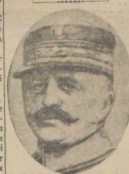
General Franchet D'Esperey

2 — Bir mmtakada ifayı va... zife eden resmî müessese ve ida... (Devamı 5 inci sahifede)