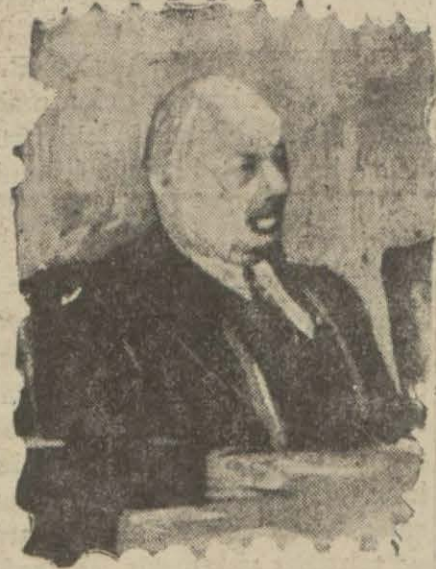
Cemiyeti akvam umumî kâtibi Sir Drummond

CENEVRE, 19 A.A. — Avrupa birliği komisyonu bir karar sureti projesi kabul etmiştir. Bunda, hali hazırda iktisadî buhranın Avrupa devletlerinin alâkadar, etmesi noktâ nazarından tetkiki ve İrlanda, Türkiye ve Rusyanın kâtibi umumîlik komisyonunun mesaisi-