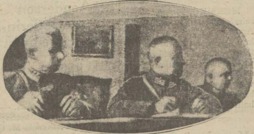
Divanı Harp Reisi Mustafa Paşa ve mahkeme ozası muhakeme esnasında