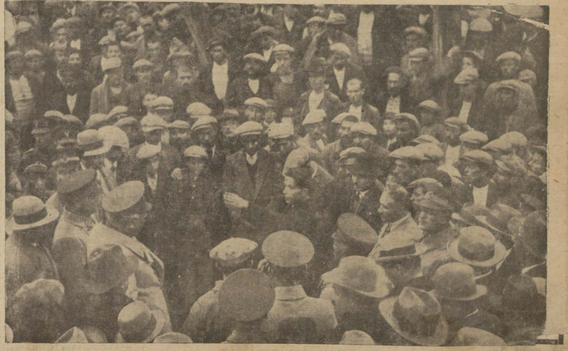
Halit şehit Kubilây'a baş kesilen veri gösteriyor ve vak'ının nasıl olduğunu Vekil Bey ve Müfettiş Paşaya