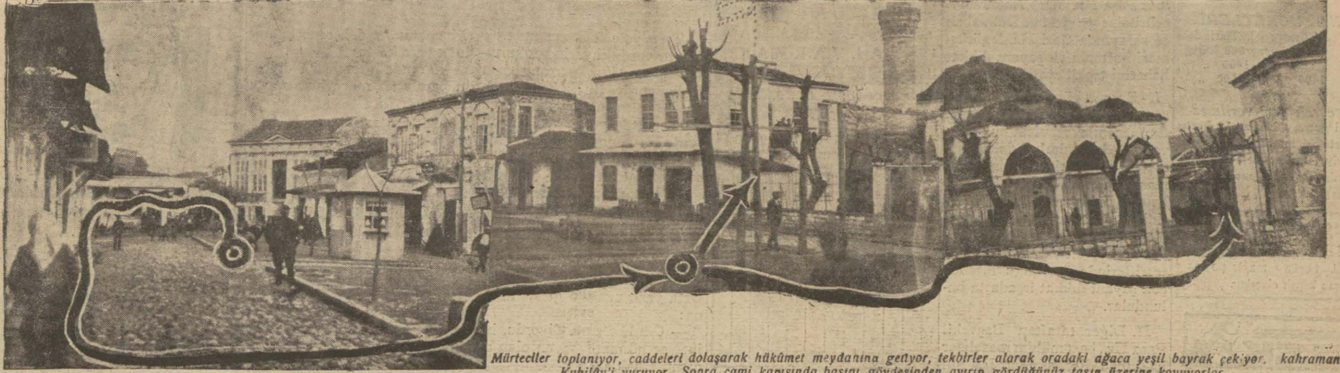
Mürteciler toplanıyor, caddeleri dolaşarak hükümet meydanına geliyor, tekbirler alarak oradaki ağaca yeşil bayrak çekiyor. Kahraman Kubilây'ı vuruyor.. Sonra cami kapısında başını gövdesinden ayırıp gördüğünüz taşın üzerine koyuyorlar

Kıralanan genç zabite haykırıyor; dur! Korkuyorsun. Seni gövdesinden ayırıp musalla taşının üzerine bırakıyor.. Çünkü sesli bir filimmiş gibi seyrediyor. Hâdise tahminimizden çok daha fecidir..