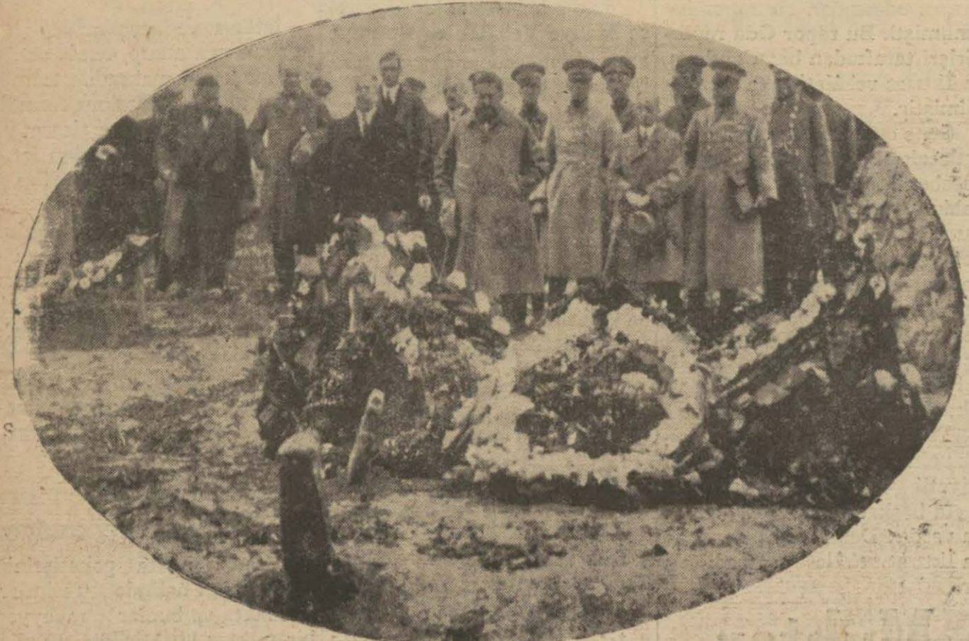
Mefkûre, memleket şehidi kahraman Kubilây'ın mezarı başında Cümhuriyetin öz çocukları göz yaşları döküyorlar

Karadeniz sahillerinde net yüksek olduğundan mur halinde teressübat y