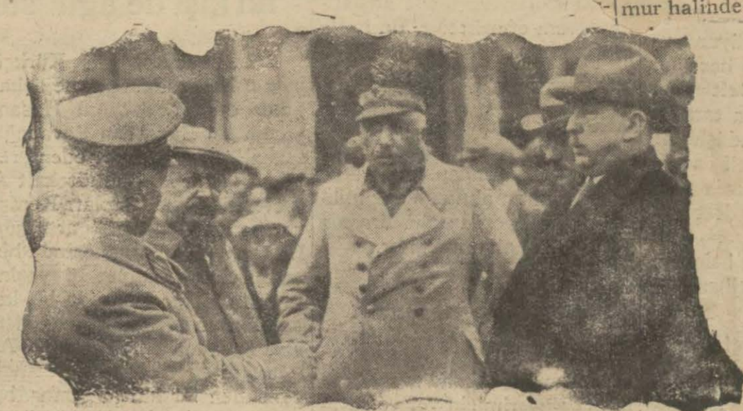
Şükrü Kaya B., Fahreddin Paşa, Vali Kâzım Paşa hâdisenin fecaatini dindedikten sonra hükümetten okuyup üflüyordu..

Ben ve camiden çıkanlar, bu hal karşısında donduk kaldık..