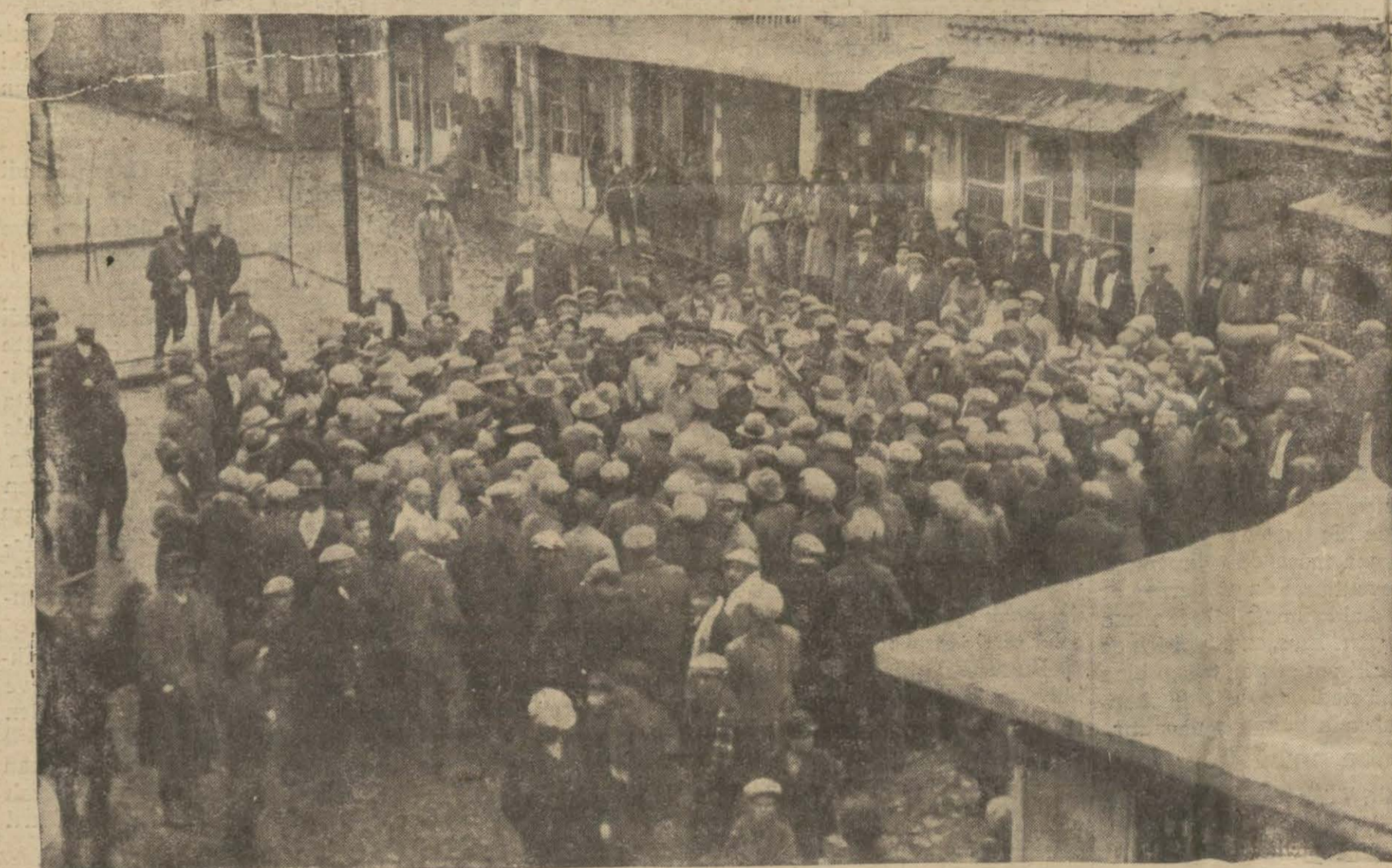
Mürtecilerin toplandıği meydanda Dahiliye Vekili halktan izahat aliyor

Aradan onbeş dakika ge-lAsilerden biri, Mehdînin y-na gelerek, zabitin cami