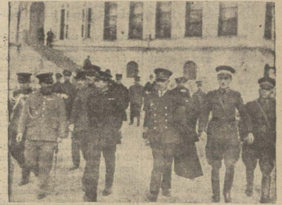
Dün prens Takamatsu Harbiye mektebini ve müzeleri gezdi. Bu resim kendisinin bahriye uniformasıyla Harbiyeden çıkışını göstermektedir.