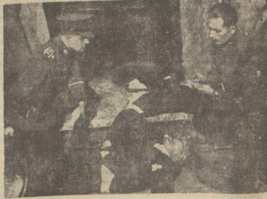
Cesetler dün gece teşhis edilmek üzere banka karakoluna getirilmiştir. (hususî foto muhabirimizin gece aldığı bir resim)

Dün akşam üzeri saat beşe doğru Galatada, tüyler ürpertici bir facia ile neticelenen bir yangın olmuştur. Faciaya sahne olan yer bir cephesi Voyvoda caddesine ve bir cephesi Perşembe pazarına nazır olan ve beş kattan ibaret bulunan Agopyan hanıdır. Gayet vasi olan bu hanın müteaddit sine-ma film şirketlerinin ajanları, Türk Arslan çimento fabrikası ile daha bir kaç çimento fabrikasının yazıhaneleri, kutu fabrikası ve v. s. yazıhaneler vardır. Hanın birinci katında bulunan Titanya film şirketine ait atelyede dün akşam üzeri bir film tecrübesiyapılırken bunlar dan biri birden bire istial edilmek üzere banka karakoluna getirilmiştir. (hususî foto muhabirimizin gece aldığı bir resim)